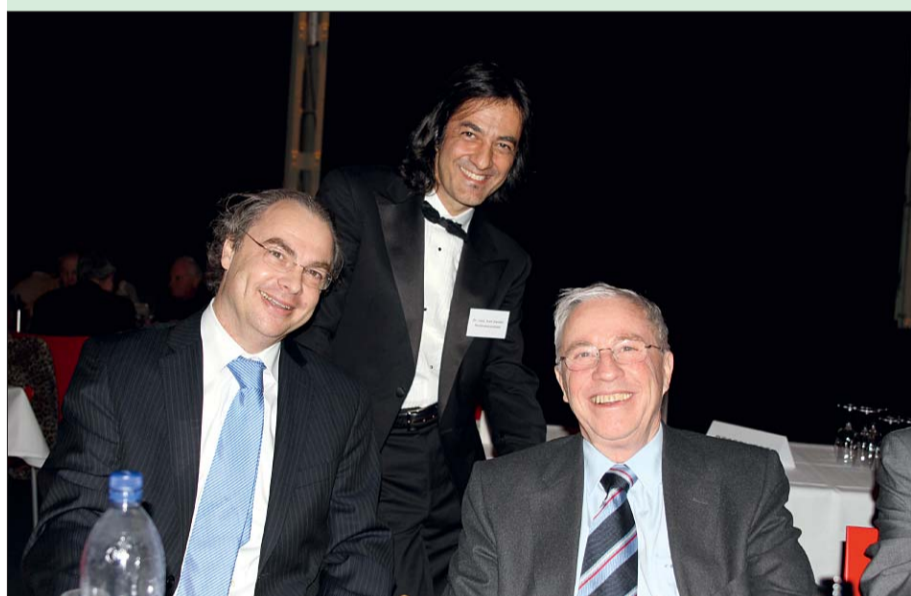
▶ Alt Bundesrat Christoph Blocher zeigte unmissverständlich auf, wie wichtig eine starke SVP für die Stadt Zürich ist.