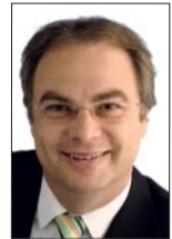
GEMEINDERAT ROGER LIEBI PRÄSIDENT SVP STADT ZÜRICH

Im Jahr 2010 werden im Kanton Zürich Gemeinderäte, städtische Exekutiven und Parlamente neu gewählt. Nach den wirtschaftlichen und politischen Turbulenzen der vergangenen Monate ist eines offensichtlich. Es braucht die Kräfte, welche vorbehaltlos für die Schweiz und ihre Werte eintreten.