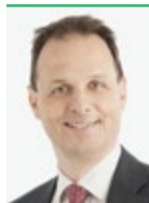
Claudio Zanetti Nationalrat SVP Gossau ZH