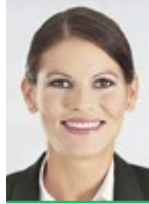
von Nina Fehr Düsel