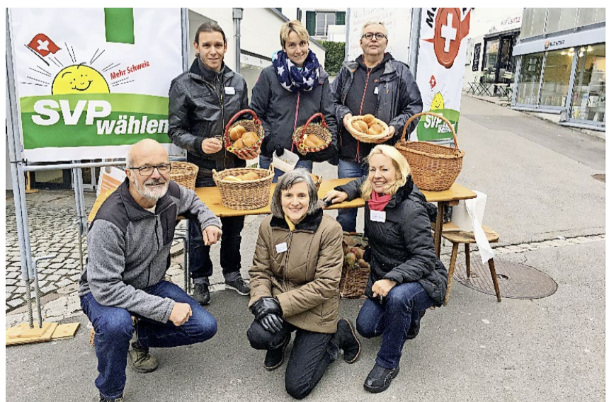
Mit Foifer und Weggli ausgerüstet: Die SVP Wädenswil bei ihrer Standaktion.

Nach dem Einstecken des Fünfers und des Weggli mit teils verschmitztem, teils ungläubigem Ausdruck auf den Gesichtern, zurück auf dem Boden der «harten» Wädenswiler Realität konnten Fragen gestellt, Anliegen formuliert, Lokales, Nationales und auch Internationales mit bestehenden und künftigen SVP Politikerinnen und Politikern diskutiert, analysiert und «zu Papier gebracht» werden. Für den Wählerauftrag der SVP ist der vielschichtige Puls der Bevölkerung wichtig und spannend, und es ergeben sich daraus massgebliche Erkenntnisse für eine bürgernahe Politarbeit. Auch wenn die «Grosswetterlage» für unsere Stadt positiv beurteilt wurde, gab es einige Verbesserungsvorschläge und Wünsche. Und somit waren wir beim Wunschbedarf angelangt, und davon war dann doch einiges auszumachen. «Sich nicht zwischen zwei angenehmen Dingen entscheiden können, sondern gleich beide haben wollen» – so die offizielle Definition – und somit halt eben doch: de Foifer und s'Weggli... auch bei uns in Wädenswil.