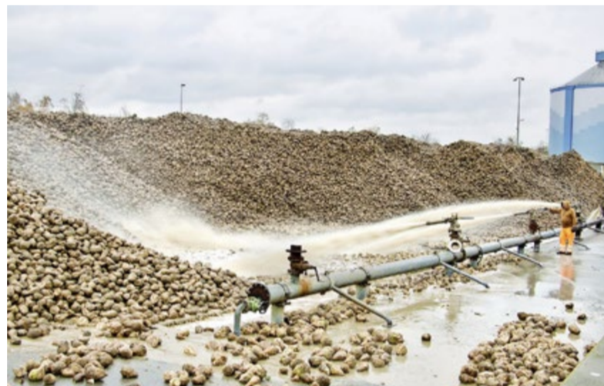
Die Kraft der Wasserkanonen bewegt die Rüben und entfernt den grössten Dreck.