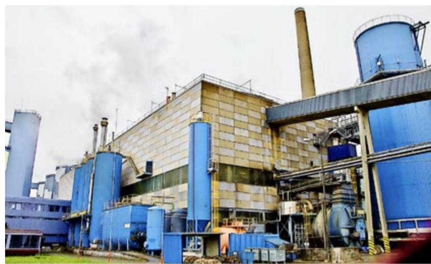
Eindrückliche Zuckerproduktion in Frauenfeld.