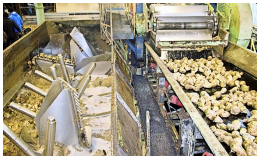
Die Verarbeitungsanlagen laufen auf Hochdruck.