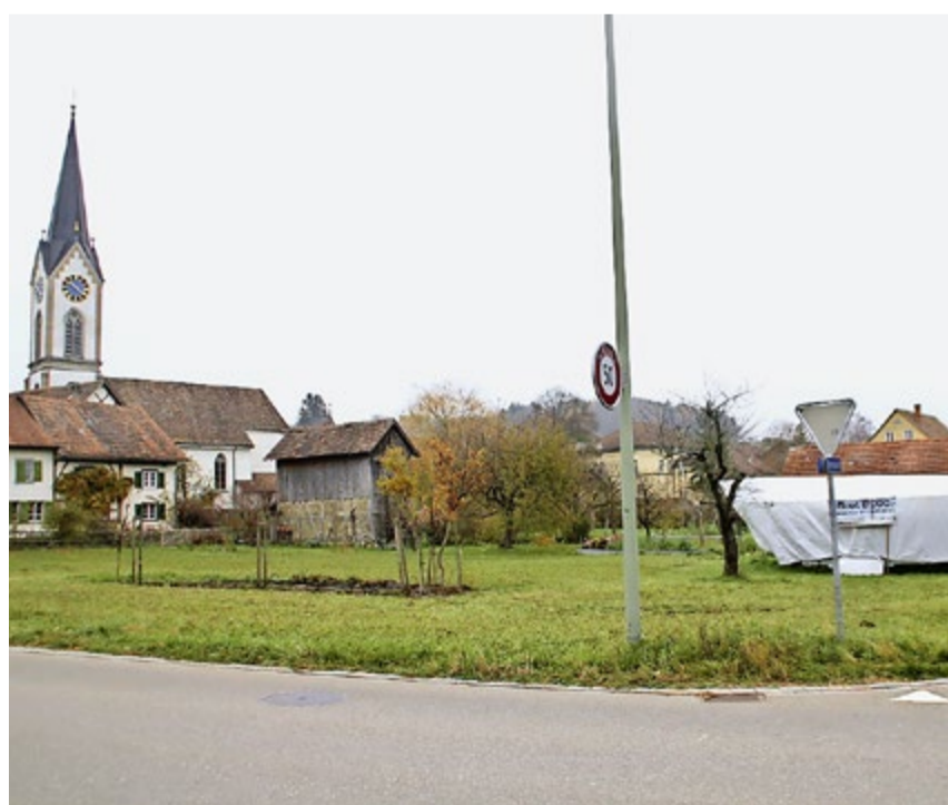
Südlich der Kirche in Benken hat der Kanton vorgesehen, aus rund 5000 m 2 eine Freihaltezone zu machen, um den Blick auf die Kirche freizuhalten.

SVP des Kantons Zürich Lagerstrasse 14 8600 Dübendorf Tel. 044 217 77 66 Fax 044 217 77 65