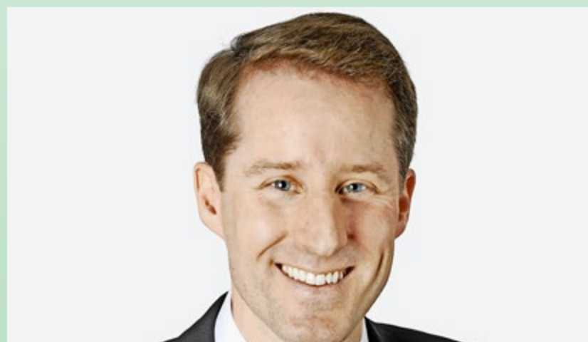
Thomas Aeschi ist neuer Fraktionspräsident der SVP-Bundeshausfraktion.

Fraktionsvorstandes gewählt. Die Mitglieder des Büros des National- und Ständerates, des Parteileitungsausschusses und des Bundesrates sind von Amtes wegen Mitglied im Parteivorstand. Der neue Fraktionsvorstand ist für die Jahre 2018/2019 gewählt und nimmt seine Aufgabe per sofort auf. Die SVP-Fraktion wird ihren langjährigen und verdienten Fraktionschef Adrian Amstutz im Rahmen der kommenden Wintersession aus dieser Funktion verabschieden.