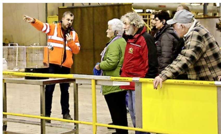
Spannende Ausführungen auf dem informativen Rundgang.

Weitere Fotos auf www.svp-huentwangen.ch .