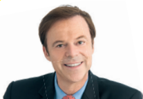
Von Christoph Mörgeli