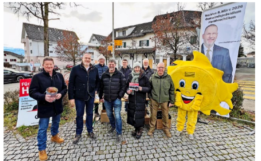
Die SVP Hombrechtikon steckt mitten im Wahlkampf, damit auf Gemeindeebene wieder die richtigen Prioritäten zum Wohle der Bürger gesetzt werden.