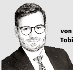
von Tobias Weidmann

Fazit: Weihnachten ist mehr als ein Fest. Es ist eine Erinnerung daran, dass unsere Freiheit auf Werten beruht, die wir nicht leichtfertig aufs Spiel setzen dürfen. Darum stehen wir ein für Ordnung, für Sicherheit und für die kulturelle Basis, die unser Land stark gemacht hat: das christliche Fundament unserer Gesellschaft.