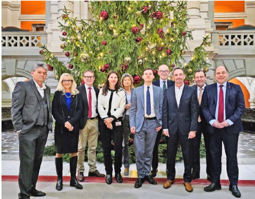
Die Zürcher SVP-Vertreter in Bern wünschen Ihnen eine frohe Adventszeit.

Am Mittwoch fand das traditionelle Weihnachtessen unserer Fraktion im Casino in Bern statt – immer ein sehr schöner Anlass, wobei ebenfalls Ehemalige und SVP-Vertreter aus den Kantonen teilnehmen. Auch am Abend gibt es immer sehr viele Anlässe und Lobbyveranstaltungen.