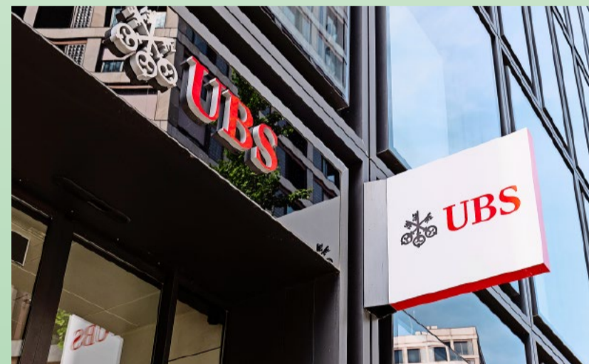
Eine mögliche Lösung wäre eine Aufteilung in eine UBS Schweiz und eine UBS Amerika.

Die Too-Big-to-Fail-Problematik wird brennender. Ob und wie könnten die Schweiz und damit die Steuerzahler die Grossbank noch auffangen? Wegen des untragbaren Risikos für die Schweiz schlage ich vor, dass sich die UBS in zwei separate Institute aufteilen sollte: eine UBS Schweiz und eine UBS Amerika, das heisst in zwei völlig getrennte Banken. Das wäre machbar: Man gibt den bisherigen Aktionären der UBS zwei Aktien. Eine für die UBS Schweiz und eine für die UBS Amerika.