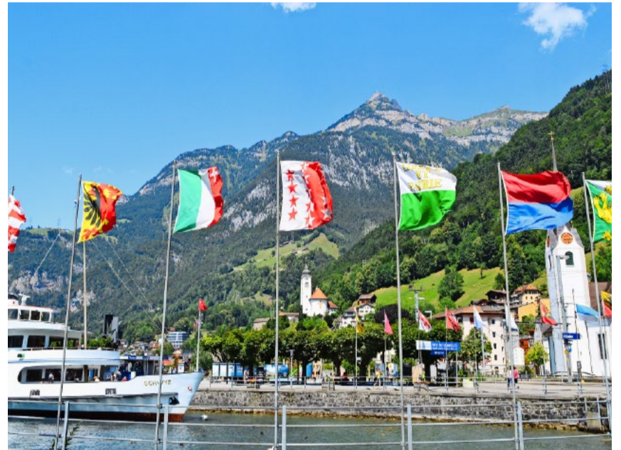
Der Bundesrat und das politische Establishment wollen das Volk umgehen und kein obligatorisches Referendum.

Mit der Übernahme der Unionsbürgerrechtlinie und dem Daueraufent-