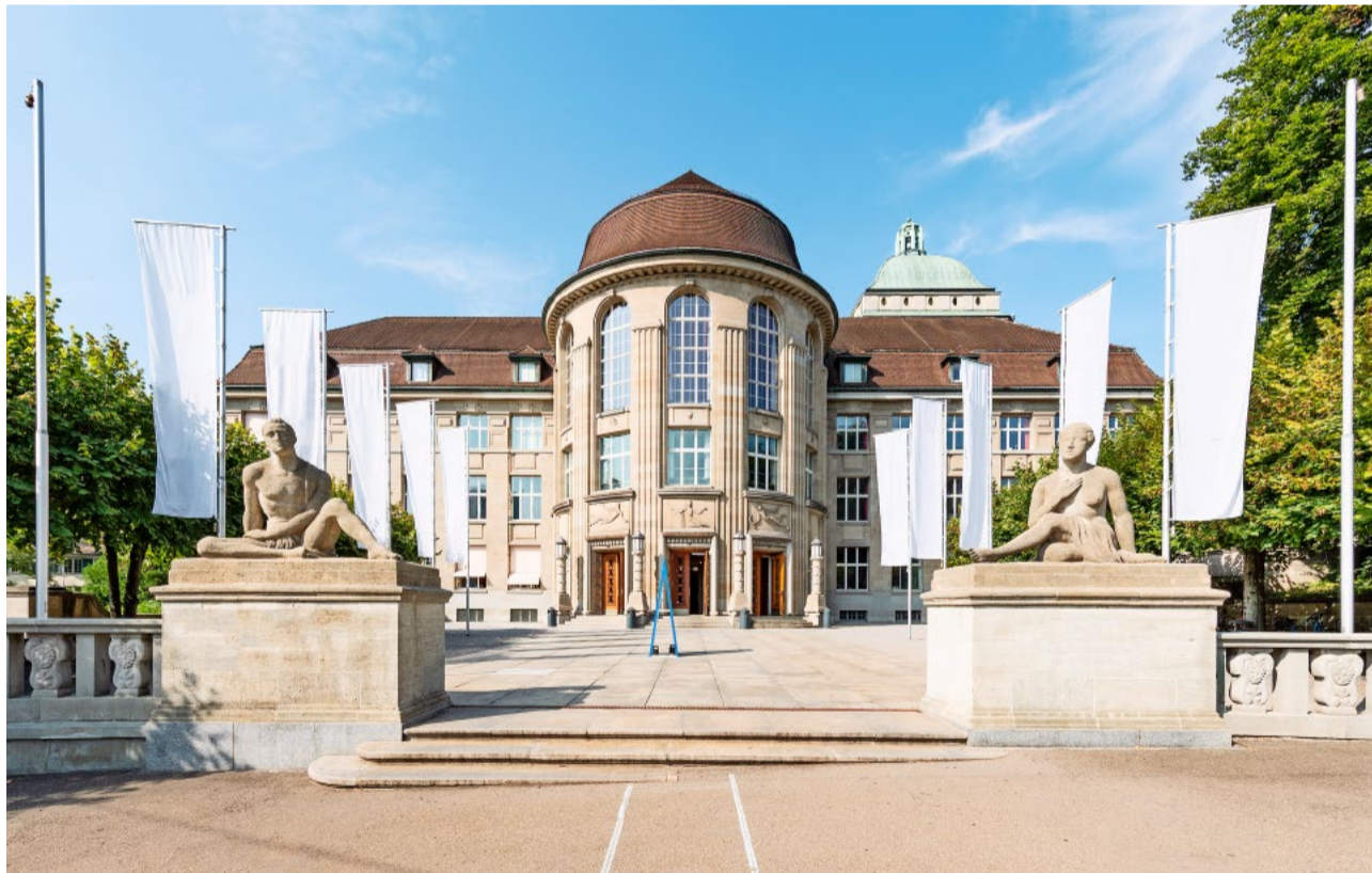
Mit dem EU-Unterwerfungsvertrag würde sich der Zustrom von ausländischen Studierenden an die Schweizer Hochschulen massiv verschärfen.

Die Folgen liegen auf der Hand: Der Zustrom von ausländischen Studierenden zu den Schweizer Hochschulen würde sich massiv verstärken und dürfte unsere Kapazitätsgrenzen bald übersteigen. Dann müsste zweifellos ein «Filter» eingebaut werden. Dieser müsste für alle «nichtdiskriminierend», also gleich, sein. Wahrscheinlich müssten die Hochschulen geeignete Aufnahmeprüfungen einführen. Das eingangs erwähnte bildungspolitische Ziel des Bundesrates und der Erziehungsdirektorenkonferenz («prüfungsfreier Zugang zur Universität mit gymnasialer Matur») wäre dann reine Makulatur.