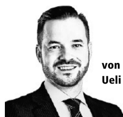
von Ueli Bamert