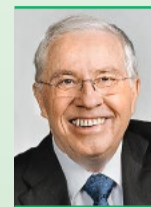
Christoph Blocher Alt Bundesrat SVP Herrliberg