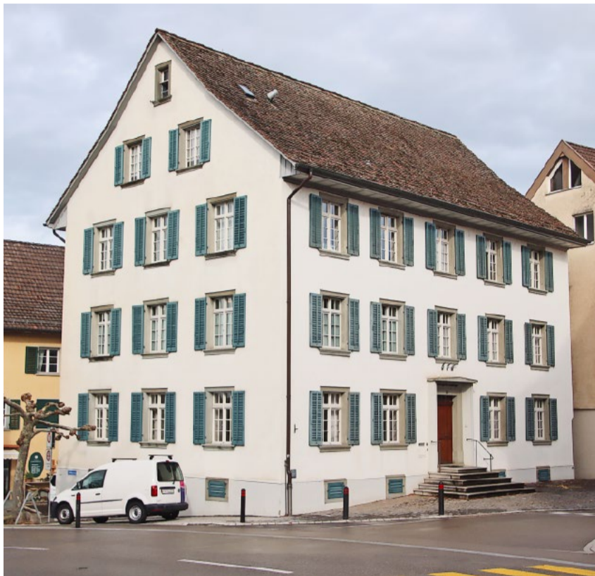
Das neu auf sechs Mitglieder aufgestockte Bezirksgerichtsgremium für den Bezirk Andelfingen ist still gewählt worden.

Neu werden nebst dem Präsidium mit 100 Stellenprozente zwei Richterstellen mit je 50 sowie drei mit je 20 Stellenprozente geschaffen. Für die eigentlichen Erneuerungswahlen lagen keine Rücktritte vor und die interparteiliche Konferenz vom Bezirk Andelfingen konnte sich im Vorfeld auf eine Sitzverteilung einigen. Dabei wird es immer schwieriger, Richterpersönlichkeiten für Teilpensen zu finden. Der