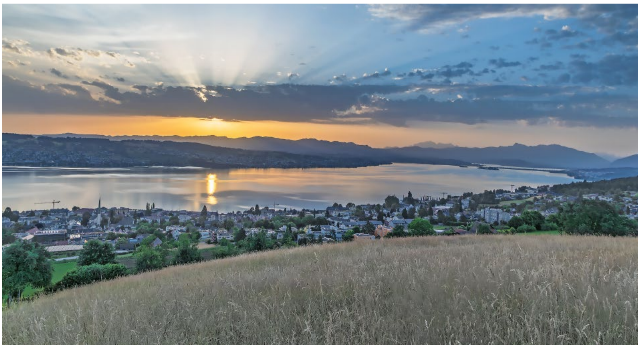
Die SVP setzt sich konsequent dafür ein, dass die Wädenswiler Steuergelder sinnvoll ausgegeben werden.

Während der verantwortliche Bundesrat Beat Jans in völlig deplatziertes Gut-mensch-Manier vor sich hindämmert, anstatt die Missstände in der Asylpolitik endlich energisch anzupacken, müssen die Gemeinden die verheerenden Konsequenzen auslöffeln. Eine fortlaufende Erhöhung der Aufnahmequote ist keine Lösung gegen die zunehmende Wohnungsnot, Integrationsschwierigkeiten, wachsende Kriminalität und explodierenden Kosten – alles zulasten der Schweizerinnen und Schweizer, die sich im eigenen Land fremd fühlen!