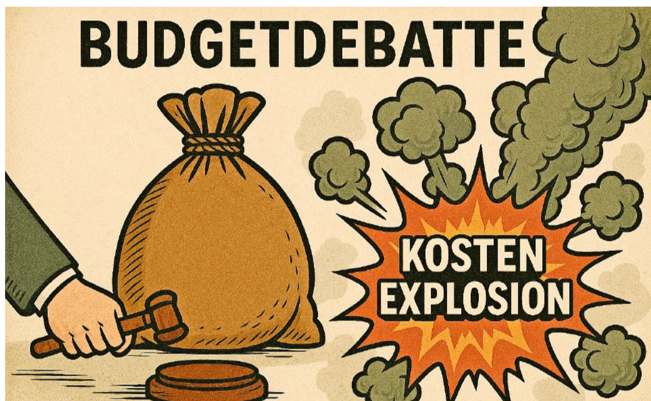
Der linksgrüne Ausgabenrausch führt zu einer regelrechten Kostenexplosion.