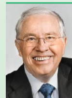
Christoph Blocher Alt Bundesrat SVP Herrliberg

Bundesrat Ignazio Cassis sprach zum vorgesehenen EU-Anbindungsvertrag: «Sie wissen – und es ist kein Geheimnis –, dass wir ein positiv besetztes Wort haben mit «bilateralen Abkommen». [...] In der Europäischen Union ist das nicht der Fall, weil das suggeriert, dass die Schweiz einen Sonderstatus hat.»