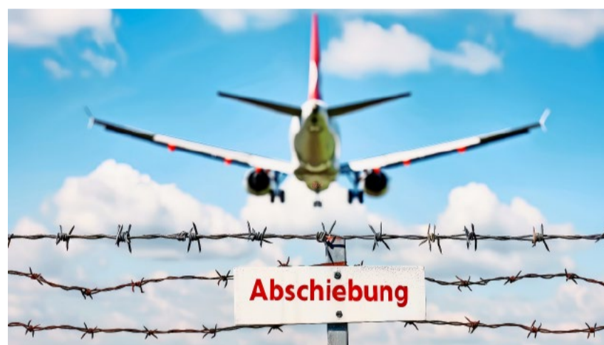
Landesverweisungen müssen konsequent durchgesetzt werden.

Die Ausflucht, das Ermessen des Richters sei wichtig, um die Verhältnismässigkeit zu wahren, ist ein billiger Vorwand. Dass die Landesverweisung zwingende Folge der Verurteilung aufgrund bestimmter Delikte ist, widerspricht dem Grundsatz der Verhältnismässigkeit nicht: Bereits das alte Strafrecht enthielt Tatbestände, bei welchen im Falle der Verurteilung obligatorisch eine Landesverweisung anzuordnen war.