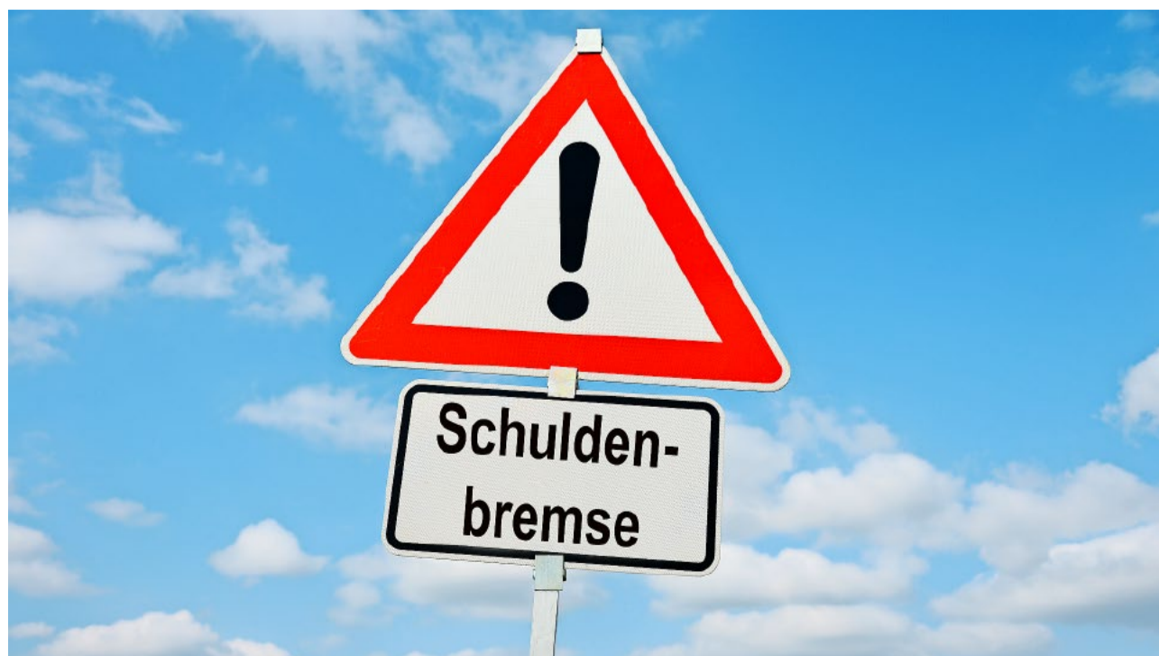
Die kürzlich überwiesene Parlamentarische Initiative zur Schuldenbremse für Bülach ist ein notwendiger Schritt zur Sicherung der Handlungsfähigkeit.

Effizienz ist kein Selbstzweck. Sie ist die Voraussetzung dafür, dass der Staat seine Kernaufgaben erfüllen kann – ohne die Bürger immer stärker zur Kasse zu bitten. Wer das ernst meint, muss den Mut haben, klare Regeln durchzusetzen. Alles andere ist Verwaltungstheater.