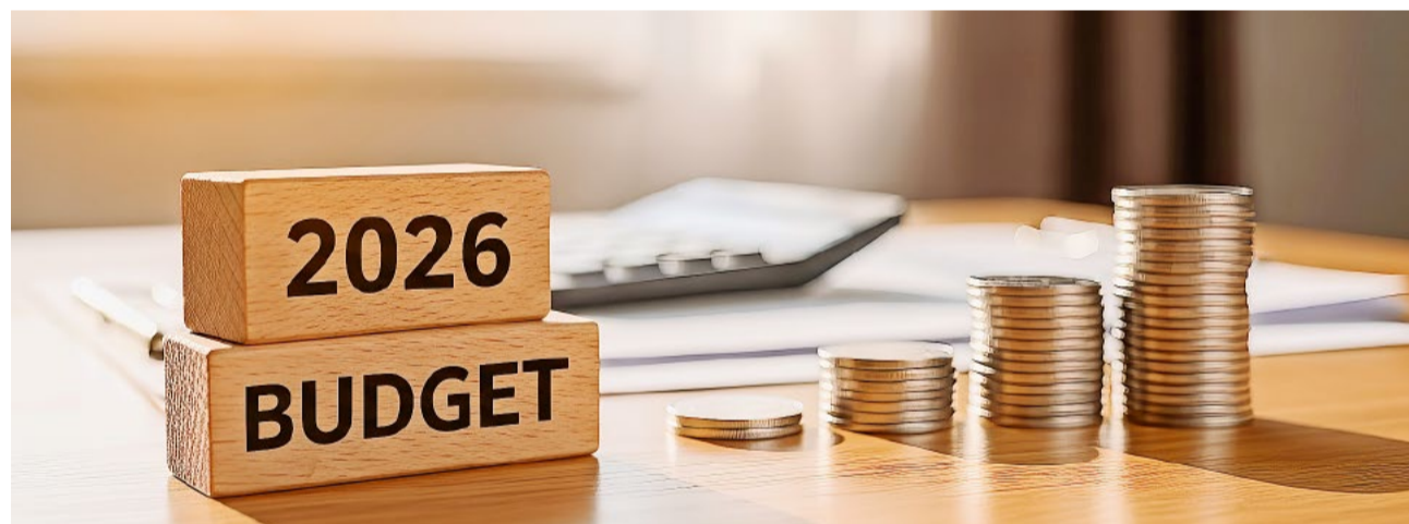
Mit über 20 Milliarden Franken Staatsausgaben erreicht der kantonale Aufwand 2026 erstmals einen historischen Höchststand.