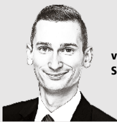
von Sean Burgess

Ich danke allen, die auch 2025 zum Gelingen dieser Zeitung beigetragen haben – mit Texten, Ideen, Rückmeldungen oder einfach durch ihr Interesse. Ich wünsche Ihnen frohe Festtage, eine erholsame Zeit zum Jahresende und einen guten Start ins Jahr 2026 – mit viel Schwung für die kommenden Aufgaben.