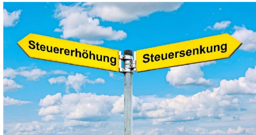
Während die Linken die Steuern gar nicht senken bzw. sogar erhöhen wollten, setzte sich die SVP konsequent für einen tieferen Steuerfuss ein.