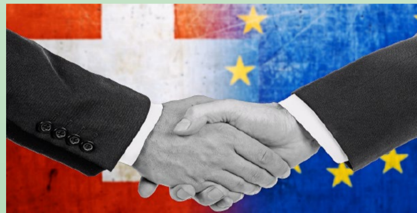
Weder «Bilaterale III» noch Vertrag auf Augenhöhe: Das EU-Abkommen ist in Tat und Wahrheit ein Unterwerfungsvertrag.

Das Gleiche gilt, wenn der Bundesrat bei der Abstimmung das Ständemehr ausschalten will. Niemand kann bestreiten, dass die neuen EU-Verträge die Bundesverfassung abändern. Eine solche Veränderung darf nur mit Zustimmung von Volk und Kantonen geschehen. Also ändert man den Wortlaut der Bundesverfassung nicht, wohlwissend, dass das EU-Recht in Zukunft über der Verfassung stehen wird. So wird die Bundesverfassung ausser Kraft gesetzt, ohne einen Buchstaben des geschriebenen Rechts abzuändern. Ein weiterer Vertrauensverlust.