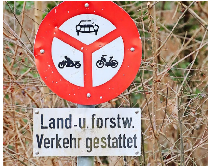
Im Wald gilt grundsätzlich ein Verbot für alle angetriebenen Fahrzeuge. Trotzdem dürfen bei solchen Vorschriftsschildern Biker mit konventionellem sowie E-Antrieb fahren.

Zugleich sind alle Bedürfnisse bei der Planung von neuen Mountainbike-Infrastrukturen zwingend zu beachten. Die Partizipation aller relevanten Beteiligten sowie das Einverständnis der Grund- und Waldeigentümer sind sicherzustellen. Hier fordert der Regierungsrat einen respektvollen Umgang aller Weg- und Waldnutzenden untereinander, welcher auch das gegenseitige Verständnis fördern muss. Zudem ist eine Verträglichkeit und Schonung von Natur,