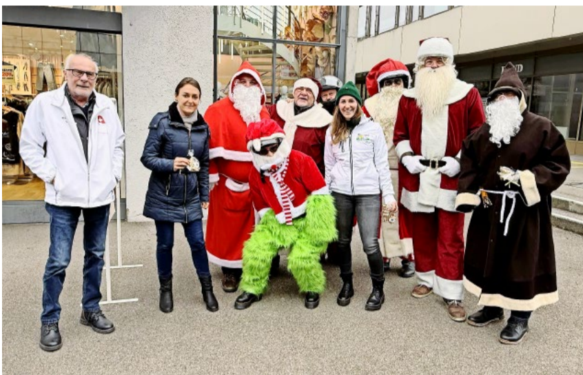
Vom Chlaus gab es feine Guetzli – natürlich mit SVP-Sünneli.