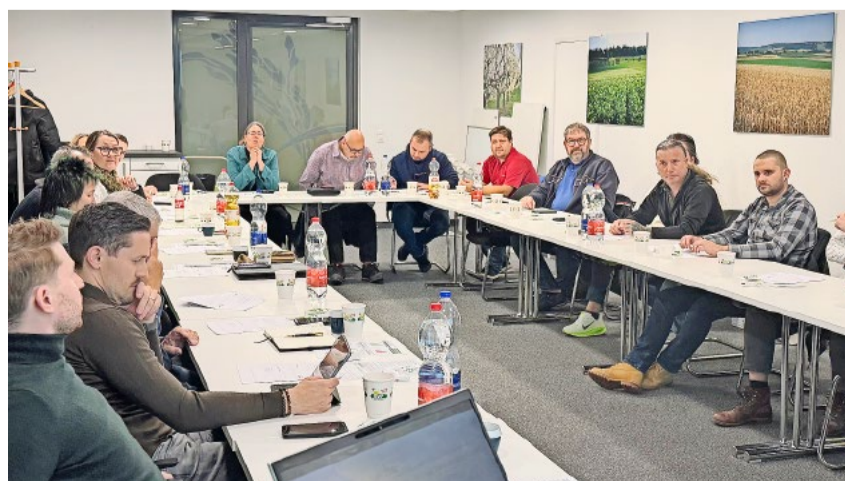
Die jeweils gut besuchten Schulungen haben gezeigt: Unsere Kandidaten sind bereit, Verantwortung zu übernehmen.

Wir danken allen Teilnehmerinnen und Teilnehmern und wünschen allen Kandidierenden viel Erfolg auf dem Weg zu den Gemeindewahlen 2026!