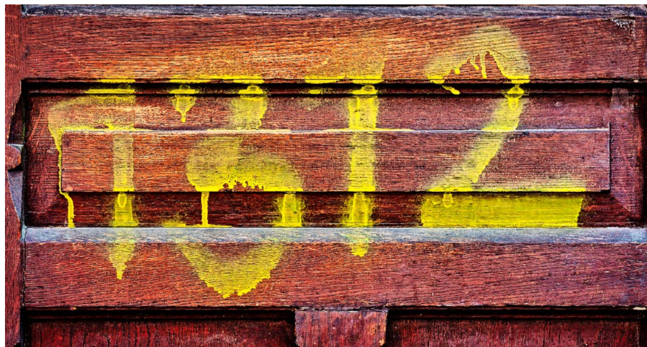
Solch polizeifeindlicher Vandalismus soll gemäss den Linksgrünen zum Stadtzürcher Alltagsbild gehören.

Jede Entscheidung hat Konsequenzen. Und irgendwann wird der Tag kommen, an dem niemand mehr den Notruf an nimmt.