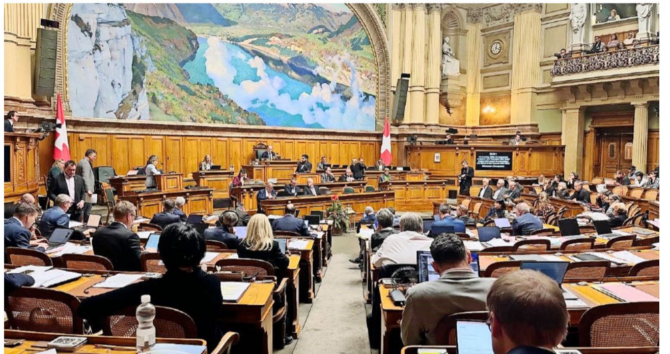
Nach einer intensiven Wintersession steht nun erst einmal ein frohes Weihnachtsfest vor der Tür.