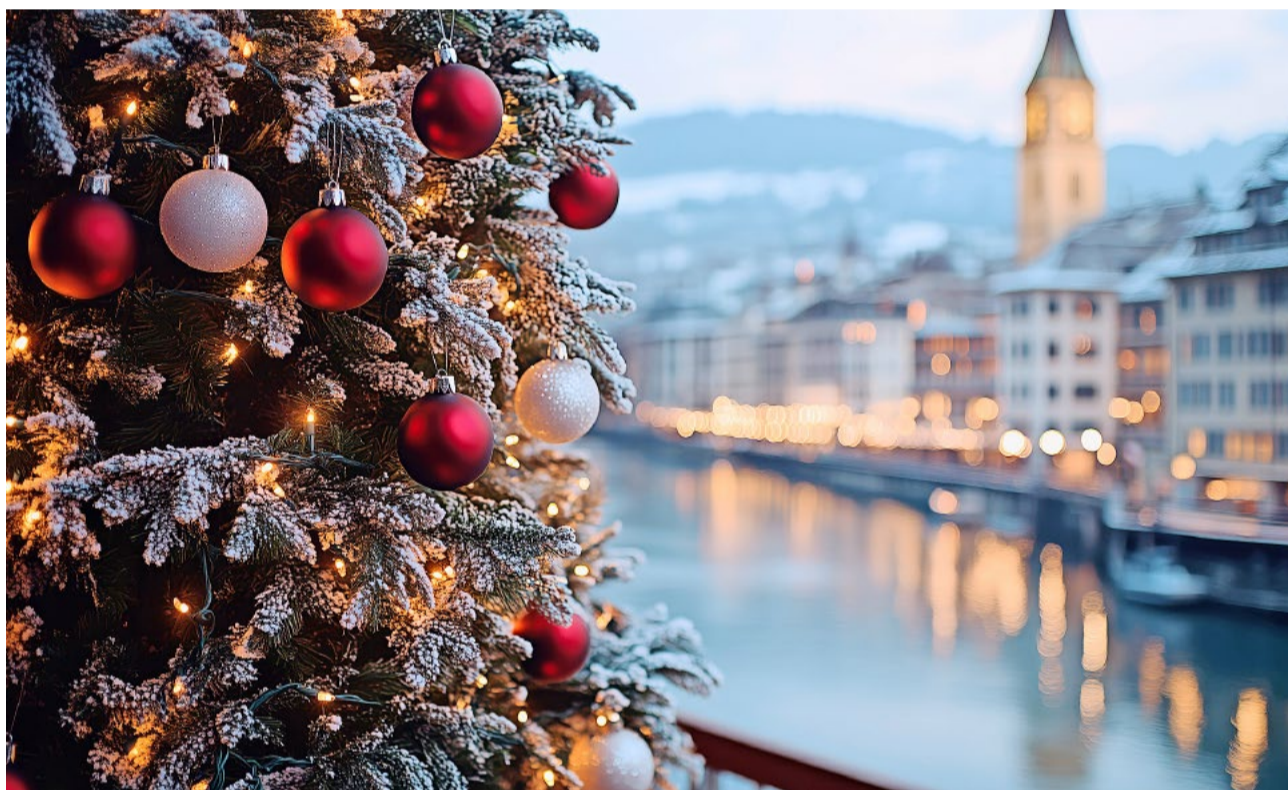
Ein erfolgreiches Jahr neigt sich dem Ende zu. Auch 2026 wird sich die SVP entschlossen für eine sichere Zukunft in Freiheit einsetzen.

2025 war kein Jahr der Schlagzeilen, sondern eines der Resultate. Die Zürcher SVP hat geliefert: an der Urne, im Parlament und in der Vorbereitung kommender Abstimmungen. Unser Kurs überzeugt – weil er Realitätssinn statt Ideologie bietet.