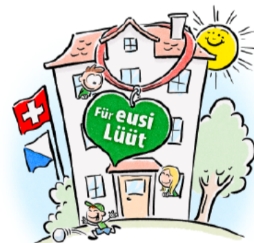
Die SVP wird die Heimatinitiative Anfang 2026 einreichen.

Die Parteileitung dankt allen, die ihren Auftrag erfolgreich umgesetzt haben.