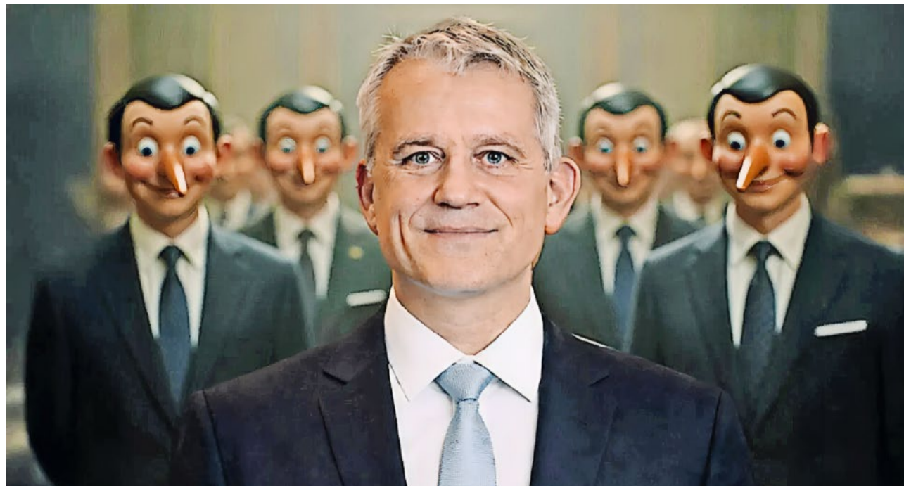
Es gibt offenbar zwei Devisen im Justizdepartement von SP-Bundesrat Beat Jans: Nichts gegen das Asyl-Chaos unternehmen und die Migrationszahlen beschönigen.

Es gibt offenbar zwei Devisen im Justizdepartement von SP-Bundesrat Beat Jans: Nichts gegen das Asyl-Chaos unternehmen und die Migrationszahlen beschönigen. Gewisse Medien – allen voran die SRG – übernehmen die Tricksereien noch so gerne: Sie halten die linke Asyl-Lüge aufrecht und wollen die Nachhaltigkeits-Initiative «Keine 10-Millionen-Schweiz!» um jeden Preis bekämpfen.