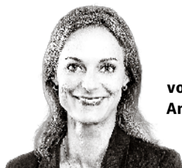
von Anita Borer