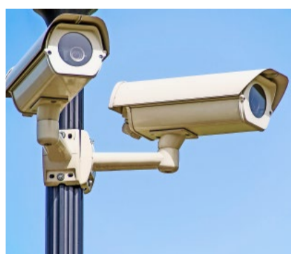
Es braucht ein sorgfältiges Abwägen zwischen notwendigen Sicherheitsvorkehrungen und dem Schutz vor Überwachung.

Anita Borer ergänzte diesbezüglich, dass die Widersprüche der linken Seite entlarvend seien. In nahezu jedem Politikbereich seien von links stets dieselben Forderungen zu hören: mehr Prävention, mehr Opferschutz, mehr Betreuung, mehr Beratungsstellen etc.