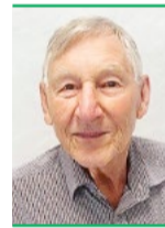
Karl Spühler Alt Bundesrichter SVP Winterthur

In einem soeben publizierten Urteil zeigt das Bundesgericht eine deutliche Entgleisung der SRG auf. Die SRG wird für ihr journalistisches Verhalten klar gerügt. Auch ihr sonstiges Verhalten im Prozess ist wenig rühmlich.