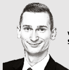
von Sean Burgess

Die Antwort sollte klar sein. Es gilt, das Vertrauen in die Bürger zu stärken, statt es durch immer neue Vorschriften zu untergraben. Denn eine starke Schweiz entsteht nicht durch einen starken Staat allein, sondern durch starke, verantwortungsbewusste Bürger.