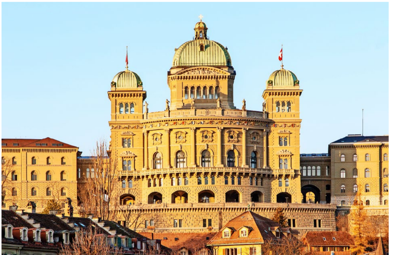
Die Eidgenössischen Räte werden sich in der kommenden Session mit wichtigen Traktanden beschäftigen.

staltungen über Mittag und am Abend beim Bundeshaus, unter anderem von verschiedenen Interessensvertretern. Zum Thema EU-Verträge gibt es ebenso laufend Veranstaltungen in der ganzen Schweiz.