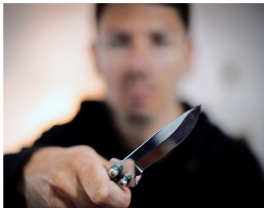
Das revidierte Polizeigesetz ist ein wichtiger Schritt, um mit den aktuellen Kriminalitätsformen und Bedrohungen Schritt zu halten.