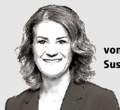
von Susanne Brunner

chen Politik und Ja zu mehr Polizei für unsere Sicherheit. Damit haben wir bei der Bevölkerung einen Nerv getroffen. Mein grosser Dank geht an unsere Kreisparteien und an die Kandidatinnen und Kandidaten in den Kreisen. Sie haben Grosses geleistet, waren permanent auf der Strasse, mit Plakaten und in den sozialen Medien präsent und haben all ihre Netzwerke aktiviert.