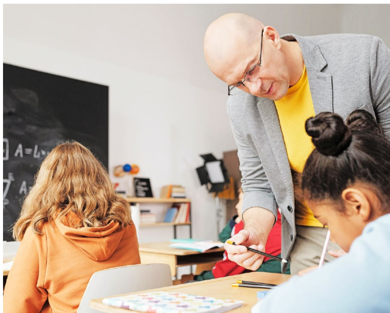
Reformen müssten gezielt erfolgen und dort ansetzen, wo sie tatsächlich Wirkung entfalten.

Damit bleibt es vorerst bei den bestehenden Strukturen in der Zürcher Bildungslandschaft. Die Mehrheit im Kantonsrat betonte, Reformen müssten gezielt erfolgen und dort ansetzen, wo sie tatsächlich Wirkung entfalten. Die Linken haben definitiv kein Verhältnis zum Geld und bedienen sich hauptsächlich am Volksvermögen.