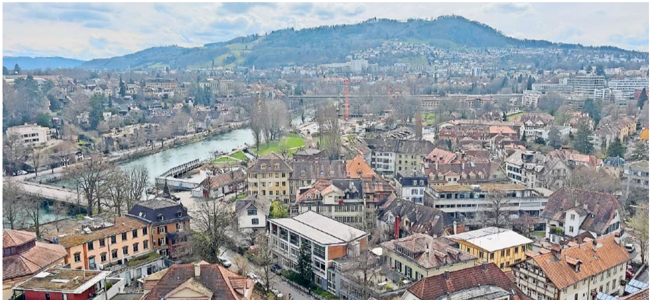
Ausblick von der Bundesterrasse.

Wir hatten diese Session auch bereits zwei Abendsitzungen, unter anderem aufgrund der langen Traktandenliste. Wiederum fanden verschiedene Abendanlässe statt, zum Beispiel vom Bankenverband, Gewerbeverband, Jardin Suisse und Baumeisterverband. Nächste Woche werden die Gänsestopfleber-Thematik sowie viele sicherheitspolitische Themen behandelt.