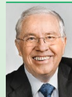
Christoph Blocher Alt Bundesrat SVP Herrliberg

Bundespräsident Guy Parmelin musste vergangene Woche nach Brüssel reisen, um einen Vertrag der institutionellen Unterwerfung der Schweiz unter die Europäische Union zu unterschreiben. Falls es zur Volksabstimmung kommt und die hiesige Stimmbevölkerung dazu Ja sagt, wird die EU in den entscheidenden Bereichen zum Gesetzgeber in der Schweiz und das EU-Gericht hätte bei Streitigkeiten das letzte Wort.