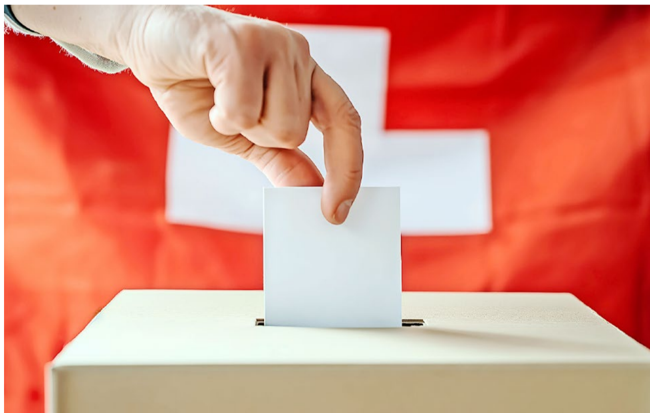
Es ist bis am 12. April nochmals Vollgas zu geben und zu mobilisieren, damit der Erfolgsgang weitergeht.

Ein grosser Teil der Zürcher Gemeinden hat am 8. März 2026 ihre Behörden neu gewählt. Die bisherigen Resultate bestätigen die breite Verankerung der SVP in der Zürcher Bevölkerung. Die Partei festigt somit ihre Rolle als führende politische Kraft in den Gemeinden.