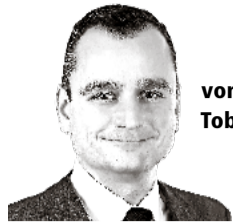
von Tobias Infortuna