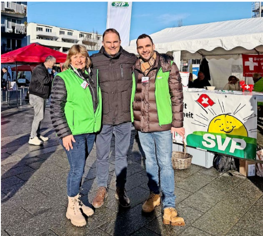
Die SVP Adliswil blickt auf einen erfolgreichen Wahlsonntag zurück.

Die SVP Adliswil wird sich im Parlament und in der Schulpflege konsequent für ihre Anliegen einsetzen und bedankt sich bei den Wählerinnen und Wählern herzlich für das Vertrauen.