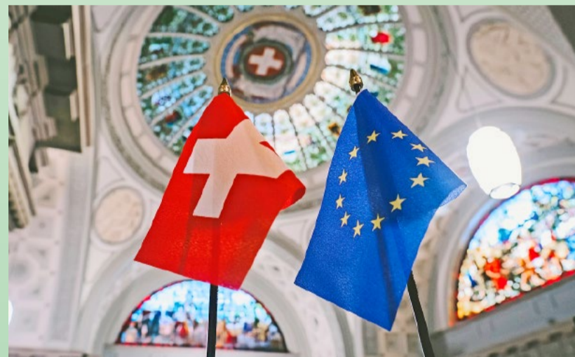
Obwohl die SVP und ihre Bundesräte persönlich gegen den EU-Unterwerfungsvertrag sind, ist Guy Parmelin verpflichtet, für den Bundesrat zu unterschreiben.

Obwohl die SVP und ihre Bundesräte persönlich gegen diesen Anbindevertrag sind, ist Guy Parmelin verpflichtet – zwar nicht in seinem Namen, sondern für den Bundesrat – zu unterschreiben. Diese Bürde müssen sowohl die SVP wie auch Parmelin persönlich auf sich nehmen. Das ist der Preis des Präsidentenamtes. Nach Entscheid im Bundesrat muss der Präsident der Kollegialbehörde diesen Beschluss vertreten. Das ist persönlich und politisch nicht einfach. So musste ich damals die Ausweitung der EU-Personenfreizügigkeit gegen meine Überzeugung