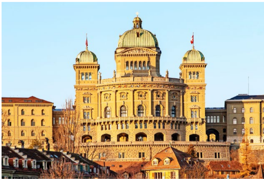
In der vergangenen Frühjahrsession sind zahlreiche, zentrale Entscheidungen in Bundesbern getroffen worden.

Der Ständerat hat leider mit nur einer Stimme Mehrheit (23 zu 22) eine wichtige Motion abgelehnt. Diese verlangte, dass die «Kompass-Initiative» dem Volk zur Abstimmung vorgelegt wird, bevor über den EU-Unterwerfungsvertrag entschieden wird. Die Kompass-Initiative fordert, dass internationale Verträge, die uns zwingen, wichtige fremde Bestimmungen zu übernehmen, automatisch dem Volk und den Ständen (Kantonen) zur Abstimmung vorgelegt werden. Die SVP wird sich weiterhin mit aller Kraft gegen diese schleichende Entmachtung des Schweizer Stimmvolks und gegen die Unterwerfung unter fremde Richter wehren.