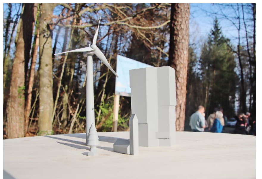
Das 3D-Modell zeigt die Grössenordnung, indem die Windräder die Kirche Andelfingen um das Fünffache oder den Prime Tower in Zürich um das Doppelte übertreffen.

Gefahren beim Befahren der Waldstrassen mit sehr schweren Fahrzeugen oder durch den baulichen Eingriff in den Untergrund. Diese können im empfindlichen Waldboden die Zuströmbereiche der Quellen massiv beeinträchtigen oder gar zum Versiegen bringen. Zugleich brachte Peter Tiegel auch die Aviatik ins Spiel. Einerseits sind im Einzugsgebiet des Flughafens Kloten Windparks ein Tabu. Andererseits hat nun auch das VBS rund um Dübendorf noch einen grösseren Perimeter gezogen, wo aus ihrer Sicht Windkraftanlagen nichts verloren haben. Entsprechend bleibt nur noch der nördliche Teil des Kantons als Eignungsgebiet übrig. Abschliessend präsentierte Martin Schaub die klaren Forderungen der IG. Es darf keine Enteignungen geben und das Mitspracherecht der Gemeinden ist zu gewährleisten. Zudem ist die Entwicklung von Alternativen zu fördern. «Es sind auch bisher unterlassene Abklärungen vor der Festlegung der Eignungsgebiete vorzunehmen», forderte Schaub abschliessend.