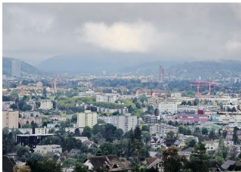
Winterthur wäre gut beraten, sich auf das Wesentliche zu konzentrieren.

Der Richtplan überlädt die Planung, verschiebt Kompetenzen und setzt einseitig auf Einschränkungen. Ein Richtplan muss Orientierung bieten – kein politisches Wunschkonzert sein. Winterthur wäre gut beraten, sich auf das Wesentliche zu konzentrieren: praktische Lösungen, klare Regeln und Respekt vor Eigentum und wirtschaftlicher Realität.