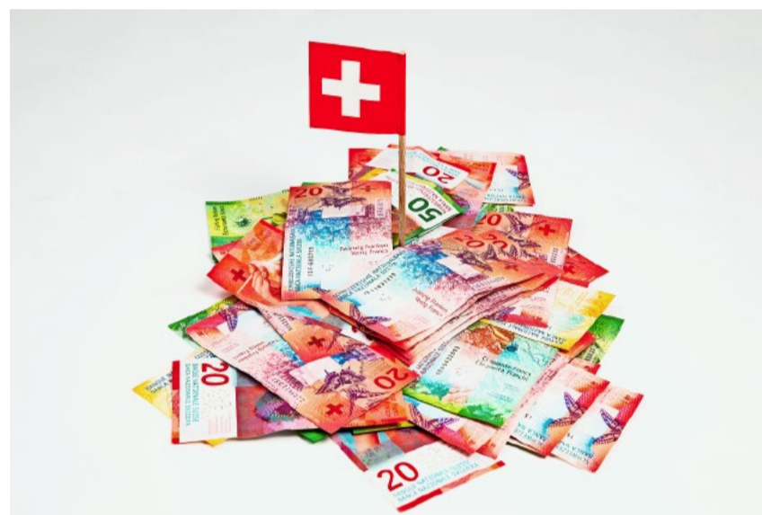
Die Bevölkerung scheint nicht bereit zu sein, eine noch höhere Mehrwertsteuer auf sich zu nehmen.

Die Mehrwertsteuer ist eine klassische Konsumsteuer. Sie fällt auf einen grossen Teil der täglichen Ausgaben an – von Kleidung über Dienstleistungen bis hin zu zahlreichen Alltagsprodukten. Steigt sie, sinkt entsprechend die Kaufkraft der Bevölkerung.