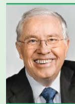
Christoph Blocher Alt Bundesrat SVP Herrliberg

Über die wichtigste Abstimmung des letzten Urnengangs hat man am wenigsten gesprochen und geschrieben: die Klimafonds-Initiative, die in allen Kantonen und mit wuchtigen 70,7 Prozent Nein-Stimmen abgelehnt wurde.