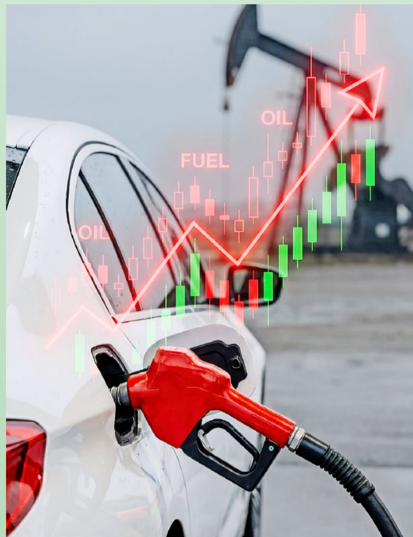
Die Preise für Benzin, Diesel und Öl sind seit Beginn des Irankriegs gestiegen.

Auch bei uns steigen jetzt die Benzinpreise spürbar. Es ist bei den Benzinpreisen immer dasselbe: Sobald es bei der Quelle knapp wird – diesmal als Folge des Irankriegs – steigt der Preis an der Tankstelle.