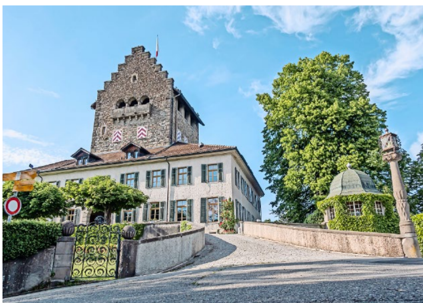
Stärken wir am 12. April die SVP – für ein lebenswertes Uster.

Wer ein freiheitliches, prosperierendes Uster und vor allem mehr Geld im eigenen Portemonnaie haben will, tut gut daran, SVP zu wählen und in seinem Umfeld zu mobilisieren. In Uster schlägt die Stunde der Selbstverantwortung. Wer jetzt nicht möglichst viele Stimmbürger an die Urne bringt, damit sie die SVP wählen, braucht nicht zu jammern, wenn er sich später im Würgegriff der Sozialisten befindet!