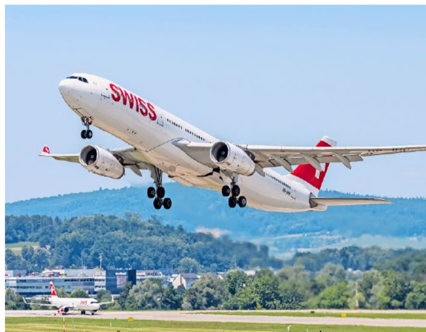
Dank den Linken und Grünen droht dem Flughafen Zürich ein riesiger bürokratischer Papierkram.

Da man an den Ostertagen den Zoo wegen der vielen Besucher meiden sollte und der Stau vor dem Gotthard lang ist, könnte man das verlängerte Wochenende dazu nutzen, nach Berlin zu fliegen, um im dortigen Zoo die in Deutschland beliebte Currywurst durch Tofu zu ersetzen. Das wäre ein gerechter Ausgleich. Aber bitte vor 23.00 Uhr fliegen.