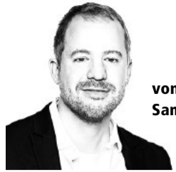
von Samuel Balsiger