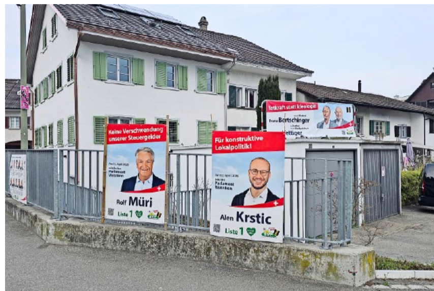
Die Gemeindewahlen vom 12. April sind für Wetzikon von grosser Bedeutung.

zu bleiben. Das Vertrauen in unsere direkten demokratischen Prozesse darf nicht durch fragwürdige Entscheide beschädigt werden.