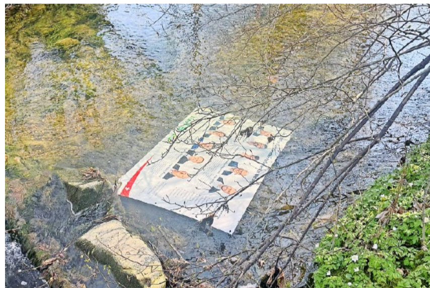
Auch in Wetzikon sind SVP-Plakate linkem Vandalismus ausgesetzt.