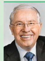
Christoph Blocher Alt Bundesrat SVP Herrliberg

Mitten in kriegerischen Ereignissen in Europa und im Mittleren Osten trifft unser Parlament einen kriegsfördernden Entscheid! Es lehnt die Neutralitätsinitiative ab und stellt sich gegen die immerwährende, bewaffnete und umfassende Neutralität – also gegen die erfolgreiche schweizerische Friedenssicherung.