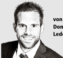
von Domenik Ledergerber

Am 14. Juni JA zur Nachhaltigkeits-Initiative «Keine 10-Millionen-Schweiz!».