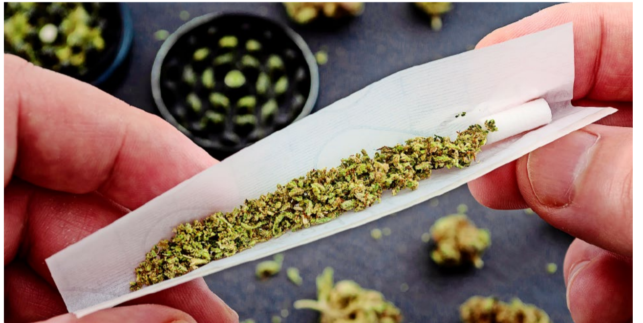
Das Projekt wirft grundlegende ordnungs- und gesellschaftspolitische Fragen auf.

Die Weisung wurde im Gemeinderat deutlich angenommen; einzig die SVP stellte sich dagegen und lehnte sie ab.