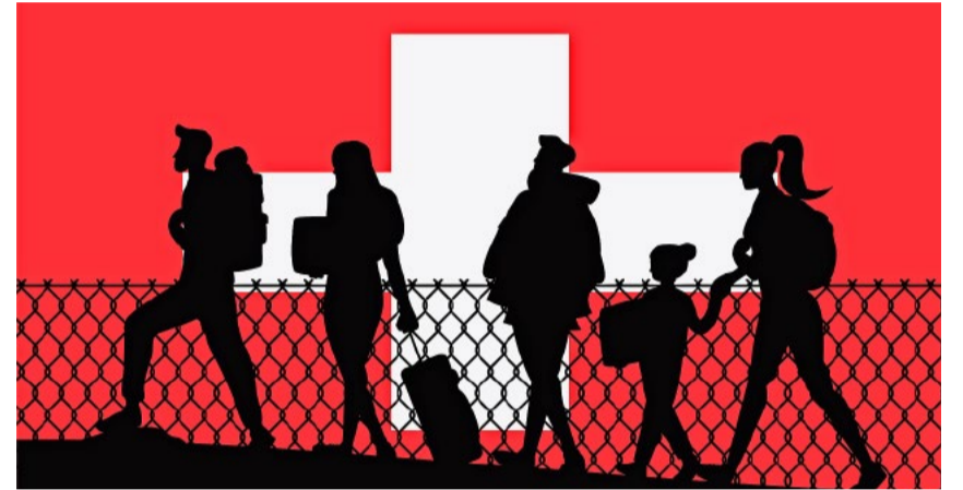
Die gravierenden Folgen der übermässigen Zuwanderung sind nicht länger tragbar.

Fazit: Der Bundesrat muss aufgrund der 10-Millionen-Initiative ganz einfach seinen Auftrag erfüllen und im Landesinteresse handeln – meines Erachtens eine Selbstverständlichkeit.