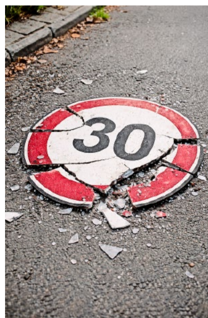
Die SVP hat erfolgreich gegen Tempo 30 rekuriert.

bei diesem Thema realistisch und erstrebenswert. Keine bürgerliche Couleur muss sich mit Alleingängen verwirklichen, aber wir erzielen realpolitische Erfolge.