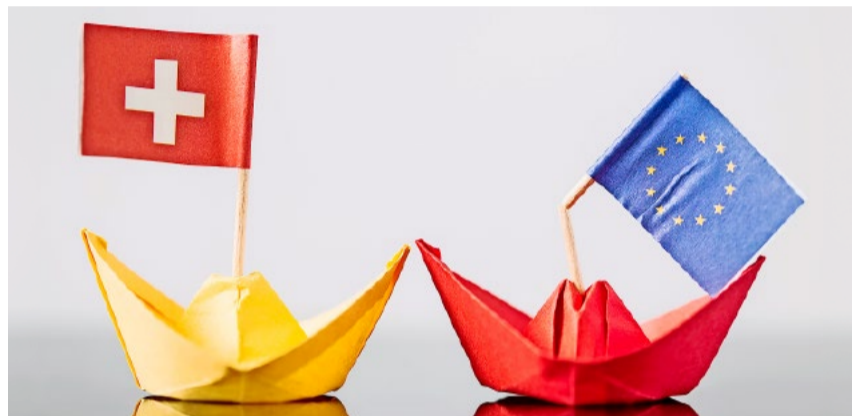
Es liegt an uns, unsere Freiheit zu bewahren.

Die erwähnte Sonderausgabe «Die neuen Verträge Schweiz-EU: Zwangsheirat mit einer schlechten Partie» liegt dieser Ausgabe des Zürcher Boten bei.