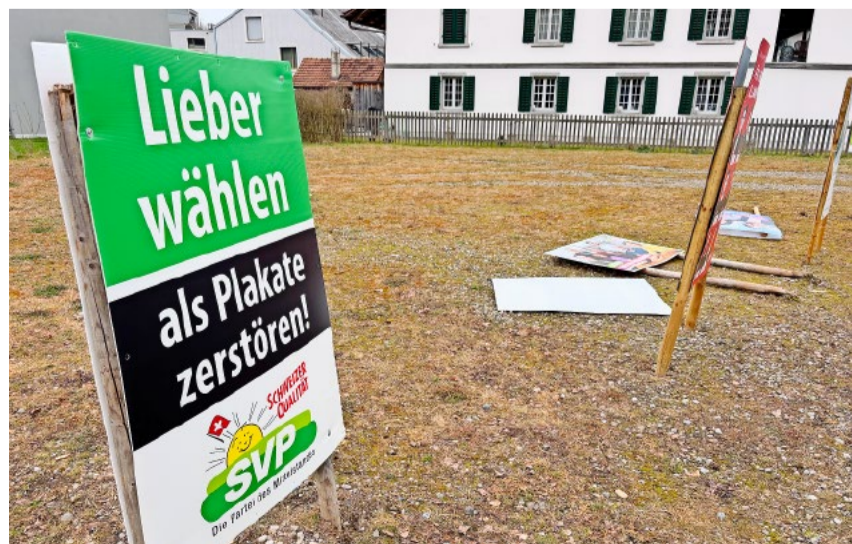
Das Plakatsujet der Kantonalpartei gegen Vandalismus traf in der Stimmbewölkerung einen Nerv.

Der Wahlsieg bringt Verantwortung mit sich. Wir müssen jetzt liefern, damit das Pendel in vier Jahren nicht wieder nach links ausschlägt. Dieser Tatendrang muss uns alle erfassen – besonders im Hinblick auf den kommenden Sonntag, den 12. April 2026. Dann finden in weiteren Zürcher Gemeinden wichtige Wahlen statt. Die bürgerliche Wende ist möglich, das hat Illnau-Effretikon bewiesen! Nutzen wir diese Learnings für den Endspurt. Gehen Sie auf die Strasse und mobilisieren Sie Ihr Umfeld. Jede Stimme zählt, um unsere Gemeinden wieder auf einen bürgerlichen Kurs zu bringen. Packen wir es gemeinsam an!