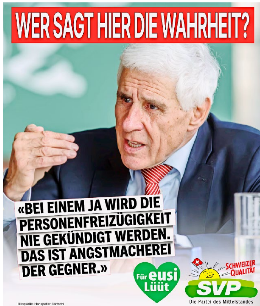
Alt SP-Nationalrat Rudolf Strahm kritisiert den «Hypermoralismus» seiner Partei in der Zuwanderungsfrage.

Die SP wurde von Rudolf Strahm in der «NZZ» arg zerzaust. Wie reagiert die linke Bundesratspartei? Gemäss «Blick» wies Samuel Bendahan, Waadtländer Nationalrat und Co-Präsident der Bundeshausfraktion, alle Vorwürfe zurück. Er nannte Strahms Argumente einen «Rundumschlag», der nicht nachvollziehbar sei. Statt mit einer Drosselung der Zuwanderung zu reagieren, will die Partei weiterhin die sinkende Kaufkraft durch eine gerechtere Verteilung der «Wohlstandsgewinne» bekämpfen. Der Schweizerische Gewerkschaftsbund nahm konkret keine Stellung zu Strahms Vorwürfen.