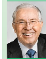
Christoph Blocher Alt Bundesrat SVP Herrliberg

Die massive Massenzuwanderung in die Schweiz beruht auf der EU-Personenfreizügigkeit und dem chaotischen Asylwesen. Dabei haben Volk und Stände 2014 die eigenständige Begrenzung der Zuwanderung beschlossen. Doch der Bundesrat und das Parlament setzten sich verfassungswidrig über den Willen des Souveräns hinweg.