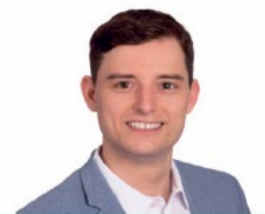
Benjamin Fischer (Nationalrat)