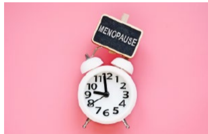
Für gewisse Kantonsrätinnen scheint die Menopause das derzeit grösste Problem in unserem Kanton zu sein.

Als kostengünstigere Variante biete ich den orientierungslosen Kantonsrätinnen an, sich vertrauensvoll an mich zu wenden. Da ich mich bereits im entsprechenden «Zeitfenster» befinde, kann ich sehr gerne einschlägige Informationen zur Verfügung stellen – und das sogar, ohne dass der Steuerzahler dafür belästigt wird.