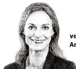
von Anita Borer