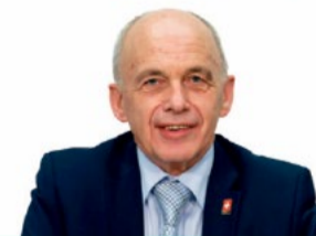
Ueli Maurer (mit Bundesrat)