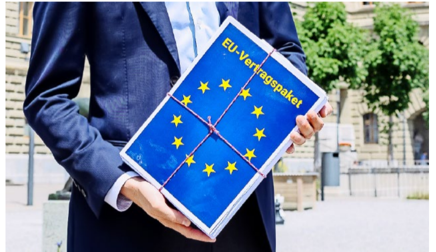
Die EU-Turbos um FDP, SP und Die Mitte haben Angst vor dem Volk – und dies aus gutem Grund.