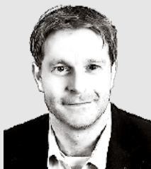
von Marco Calziglia

Habt ihr noch keine Fahne, keinen Autokleber oder wisst ihr noch nicht, wie ihr unsere Initiative unterstützen könnt? Dann meldet euch bei mir; unsere Partei ist für jede Unterstützung dankbar.