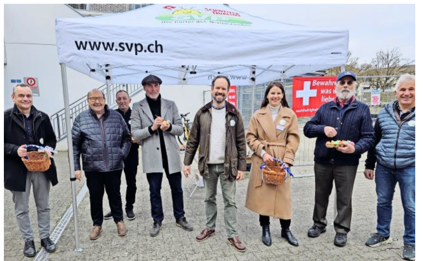
Das Eiertütchen stand dieses Jahr im Zeichen der Nachhaltigkeits-Initiative «Keine 10-Millionen-Schweiz!».

Staat. Wäre die von Volk und Ständen angenommene Masseneinwanderungsinitiative aus dem Jahr 2014 vom Parlament umgesetzt worden, wäre jetzt die Nachhaltigkeits-Initiative nicht nötig. Es geht jetzt darum, den Druck auf Bun-