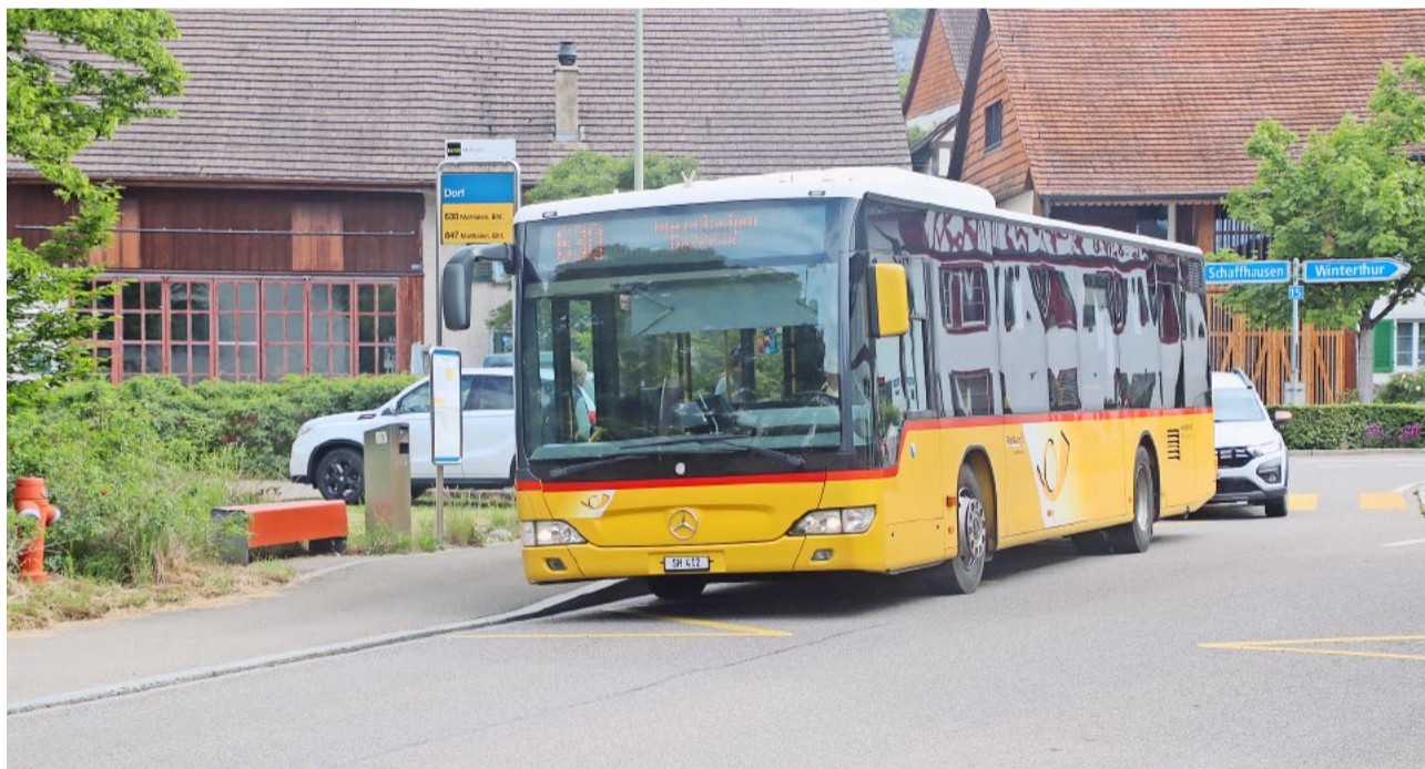
Das Weinland dient als Versuchsregion für das automatisierte Fahren von öffentlichen Verkehrsmitteln, es wird aber noch einige Zeit dauern, bis das Postauto ohne Chauffeur unterwegs sein wird.

Dasen sprach zudem von den nun geplanten weiteren Arbeitsschritten. Zuerst werden konkrete Angebotsformen und -konzepte in Varianten und Szenarien ausgearbeitet. Danach werden Varianten auf der Basis eines Tools der SBB modelliert und simuliert. In einem weiteren Schritt werden die Angebotskonzepte hinsichtlich Potenzial und Risiken bewertet und verglichen. Daraus lassen sich dann die erforderlichen Massnahmen evaluieren sowie die Herausforderungen und Hürden bei der Umsetzung benennen. Schlussendlich sprach Dasen auch von den politischen Zielen und Kundennutzen sowie den Kosten. Dabei werden die Kosten per Personenkilometer sowie die Auslastung und Leerfahrten verglichen. Die Tarife und Kosten für die ÖV-Nutzer und die Besteller bezüglich Kostendeckungsgrad werden jedoch ein Thema sein. Zudem gilt es, auch den Flächenbedarf für das Abstellen, das Laden und die Reinigung zu thematisieren.