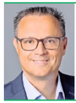
Ralph Studer Stiftung Zukunft CH

Die neuen EU-Verträge wirken technisch und harmlos. Doch hinter den nüchternen Begriffen steht ein Umbau, der tief in unsere demokratische Ordnung und freiheitlichen Werte eingreift, die die Schweiz stark gemacht haben.