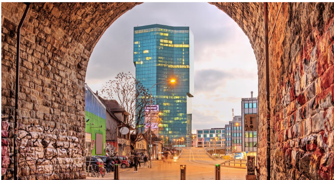
Dieses Verhalten der Stadt ist mehr als nur schlechter Service – es ist eine systematische Abwälzung von Verantwortung auf die Bürgerinnen und Bürger.

Die BZO-Revision wird weitreichende Auswirkungen auf Eigentum und Lebensplanung vieler Menschen haben. Umso mehr ist es Aufgabe der Behörden, diese Menschen nicht im Unklaren zu lassen. Der Stadtrat muss jetzt handeln – verbindlich, klar und ohne weitere Verzögerung. Alles andere wäre ein Armutszeugnis für eine öffentliche Verwaltung, die den Anspruch hat, für alle da zu sein.