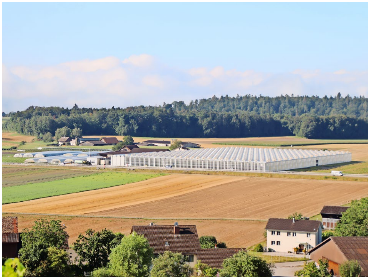
Im Kanton Zürich können seit dem 29. September 2023 ausserhalb der Bauzonen nur noch 817 Gebäude gebaut und maximal 520 000 m 2 Boden versiegelt werden.

Die öffentliche Vernehmlassung ist im Frühling 2027 geplant. Spörri machte deutlich, dass diese neuen Vorgaben das Bewilligungsverfahren weiter belasten, indem zusätzlich auch die bei Bauten anfallende versiegelte Fläche erfasst werden muss. Aufgrund einer Frage machte Spörri aber geltend, dass eine Liegenschaft wie beispielsweise ein Hühnerhaus mit einer Mindestfläche von sechs Quadratmetern als anrechenbare Baute gilt. Wird eine Liegenschaft ausserhalb der Bauzonen zurückgebaut, so leisten der Bund und der Kanton eine Abbruchprämie, damit der Weg für einen Neubau frei wird.