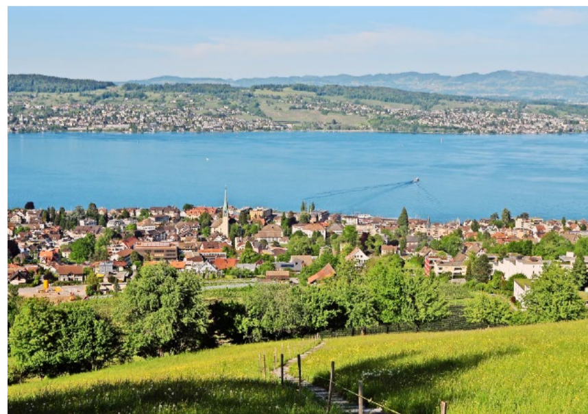
Allianzen mit anderen (bürgerlichen) Parteien sind inskünftig noch kritischer zu hinterfragen; ein Verzicht darf und soll eine reelle Option sein.

denswilerinnen und Wädenswiler, zu hohe Ausgaben für das Asylwesen, überlastete Hauptverkehrsachsen, ein zu aufgeblähter Verwaltungsapparat, hohe Steuern und vieles mehr – alles Missstände, gegen welche die SVP ankämpft und deren Hauptursache die Massenzuwanderung ist! Offenbar ist es aber immer noch bequemer, einfach nur herumzumotzen, anstatt alle vier Jahre ein Wahlcouvert in den nächstgelegenen Briefkasten zu werfen – von einem aktiven politischen Engagement erst gar nicht zu reden.