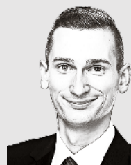
von Sean Burgess

Es ist daher angezeigt, zur sachlichen Debatte zurückzukehren. Argumente sind zu prüfen, Positionen kritisch zu hinterfragen und unterschiedliche Perspektiven ernst zu nehmen. Die Zukunft unseres Landes ist zu bedeutend, um sie parteipolitischen Reflexen zu überlassen.