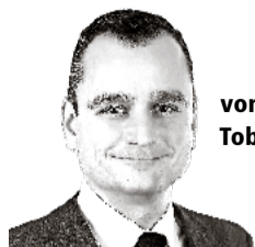
von Tobias Infortuna