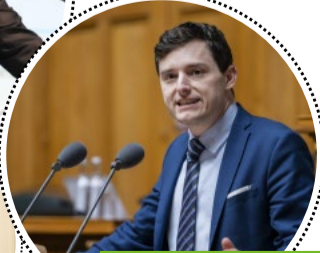
Benjamin Fischer Nationalrat