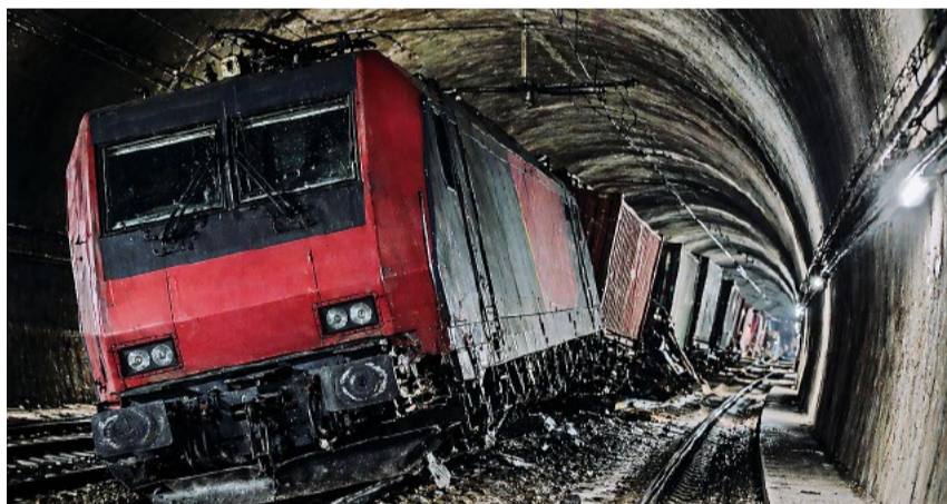
Die Schweiz hat aus einem konkreten Unfall gelernt und die notwendigen Konsequenzen gezogen. Genau so funktioniert Verantwortung.

Die Schweiz hat die Pflicht, ihre Bevölkerung und ihre Infrastruktur zu schützen. Nicht Brüssel und nicht auf Druck von aussen. Hier darf kein Millimeter nachgegeben werden.