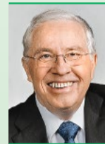
Christoph Blocher Alt Bundesrat SVP Herrliberg

Die Region des Nahen und Mittleren Ostens war seit je unruhig. Drei Religionen prallen dort aufeinander. Neuestens besteht die Gefahr, dass sich der Konflikt kriegerisch ausweitet. Denn es geht um den gefährdeten Nachschub von Erdöl. Dieser wichtige Rohstoff dient nicht nur zum Heizen, sondern ist auch der Grundstoff für Textilien, wertvolle Kunststoffe aller Art und auch Elektrizität.