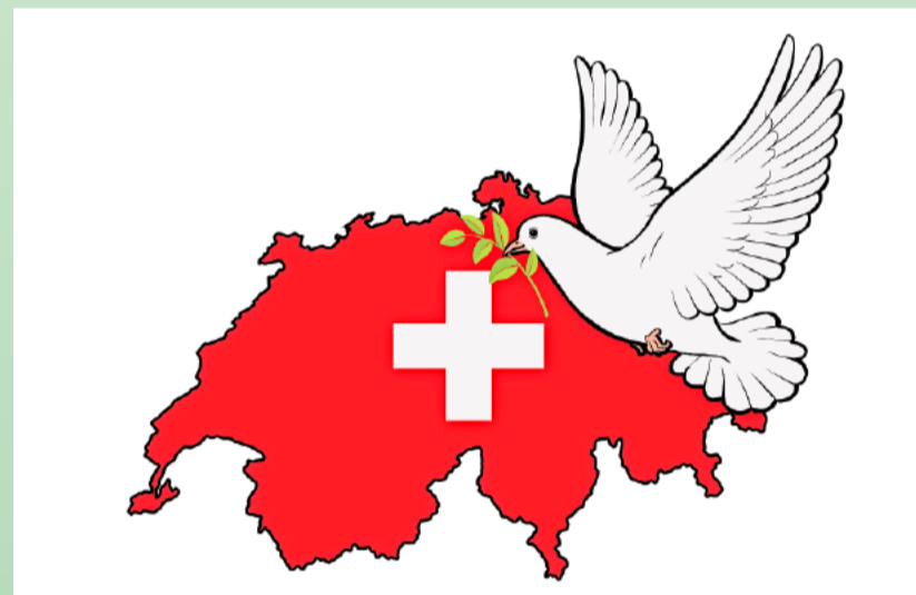
Eine klare und glaubwürdige Neutralität schützt unser Land vor fremden Konflikten.

Es bleibt nur zu hoffen, dass angesichts der sich ausbreitenden Kriegsgefahr bei uns der Hinterste und Letzte merkt, wie wichtig die schweizerische Neutralität ist. Ausdrücklich: die schweizerische, also die immerwährende, bewaffnete und umfassende (integrale) Neutralität, die auch die nicht militärischen Zwangsmassnahmen (Wirtschaftsboykotte, diplomatische Zwangsmassnahmen usw.) ausschliesst. Die Golf-Staaten haben sich im Irankrieg auch sofort neutral gegeben. Aber glaubwürdig ist diese Neutralität nicht, wenn dort gleichzeitig die USA militärische Stützpunkte und Marine-Häfen unterhalten. Umso mehr muss unsere Neutralität wieder glaubwürdig werden.