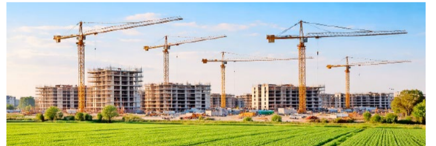
Jede Sekunde wird ein ganzer Quadratmeter (!) verbaut – es ist höchste Zeit, unsere Heimat zu schützen.

Die gute Nachricht: Es liegt auch eine echte Lösung auf dem Tisch. Am 14. Juni haben wir die Chance, die Weichen für die Schweiz neu zu stellen. Ein JA zu unserer Nachhaltigkeits-Initiative «Keine 10-Millionen-Schweiz!» bedeutet: Ursachen anpacken statt Symptome verwalten. Diese Abstimmung müssen wir unbedingt gewinnen, damit die Schweiz Schweiz bleibt und auch künftige Generationen in einer lebenswerten Schweiz aufwachsen dürfen.