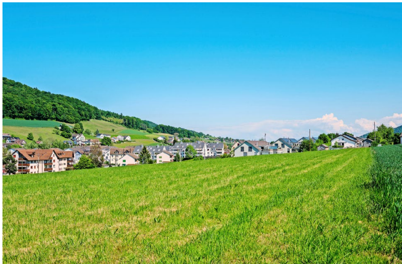
Die Initiative des HEV Zürich will mehr preisgünstigen Wohnraum für den Mittelstand schaffen.

Am 14. Juni stimmt die kantonale Stimmbevölkerung über insgesamt drei Volksinitiativen zum Thema Wohnen ab. Zwei Initiativen haben einen linksgrünen Absender. Eine Initiative ist durch den Hauseigentümergebund Kanton Zürich lanciert worden.