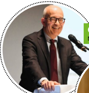
Gregor Rutz Nationalrat

Ref. Kirchgemeindehaus Rösslirain 2, 8702 Zollikon