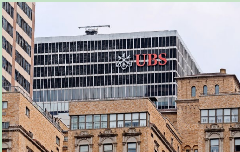
UBS-Filiale in den USA: Auslandsgeschäfte systemrelevanter Banken bergen auch Risiken für die Schweiz.

Die Migros hat ebenfalls ihre Erfahrungen gemacht. Bei der Abstimmung über den Europäischen Wirtschaftsraum (EWR) kämpfte CEO Eugen Hunziker für den Beitritt. Nach dem Nein kaufte er aus Zorn die Familia-Filialen in Österreich – und verlor 1993 bis 1995 prompt Hunderte von Millionen Franken. Nein, man muss trennen, was nicht zusammengehört!