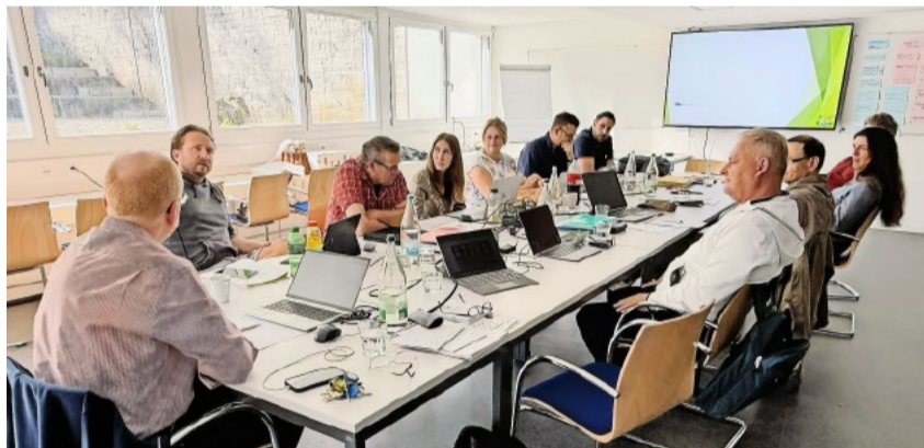
Im Zentrum der Zusammenkunft stand die Weiterentwicklung des Parteiprogramms.