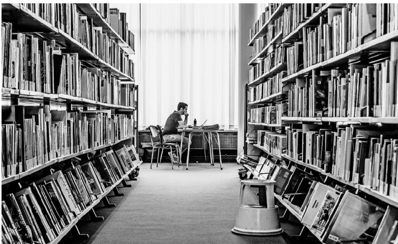
Es braucht in der Bildungspolitik eine offene und ehrliche Debatte über zentrale Fragen.

Zwischen diesen beiden Polen gilt es, eine tragfähige Balance zu finden. Diese entsteht nicht von selbst – sie ist das Ergebnis klarer politischer Entscheidungen und konsequenter Prioritätensetzung.