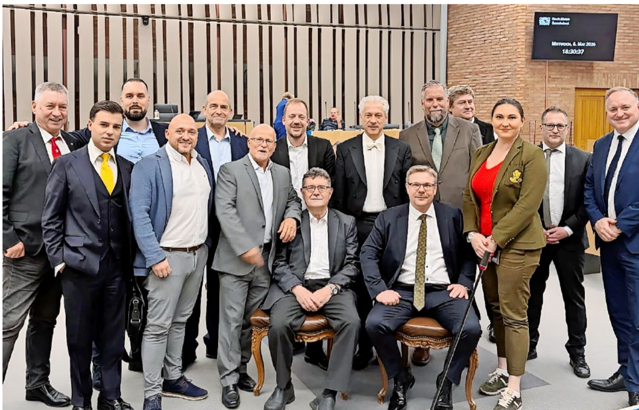
Die SVP-Fraktion hat die neue Legislatur in Angriff genommen.

Dieser Appell zeigte im Verlaufe der Ratssitzung Wirkung. Die drei Parteien Grüne, SP und AL wollten einem SVP-Kandidaten die Wahl zum Vizepräsidenten in die Geschäftsprüfungskommission verweigern. Obwohl diese drei Parteien über eine Mehrheit im Parlament verfügen, brachten sie die Mehrheit zur «Nichtwahl» nicht zustande, und der SVP-Kandidat wurde wie von der SVP-Fraktion vorgeschlagen erfolgreich gewählt.