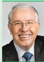
Christoph Blocher Alt Bundesrat SVP Herrliberg

Um bei einem Absturz der UBS die Gefahr für die Schweizer Volkswirtschaft zu reduzieren, sollen bei systemrelevanten Banken die ausländischen Tochtergesellschaften künftig vollständig mit hartem Eigenkapital unterlegt sein.