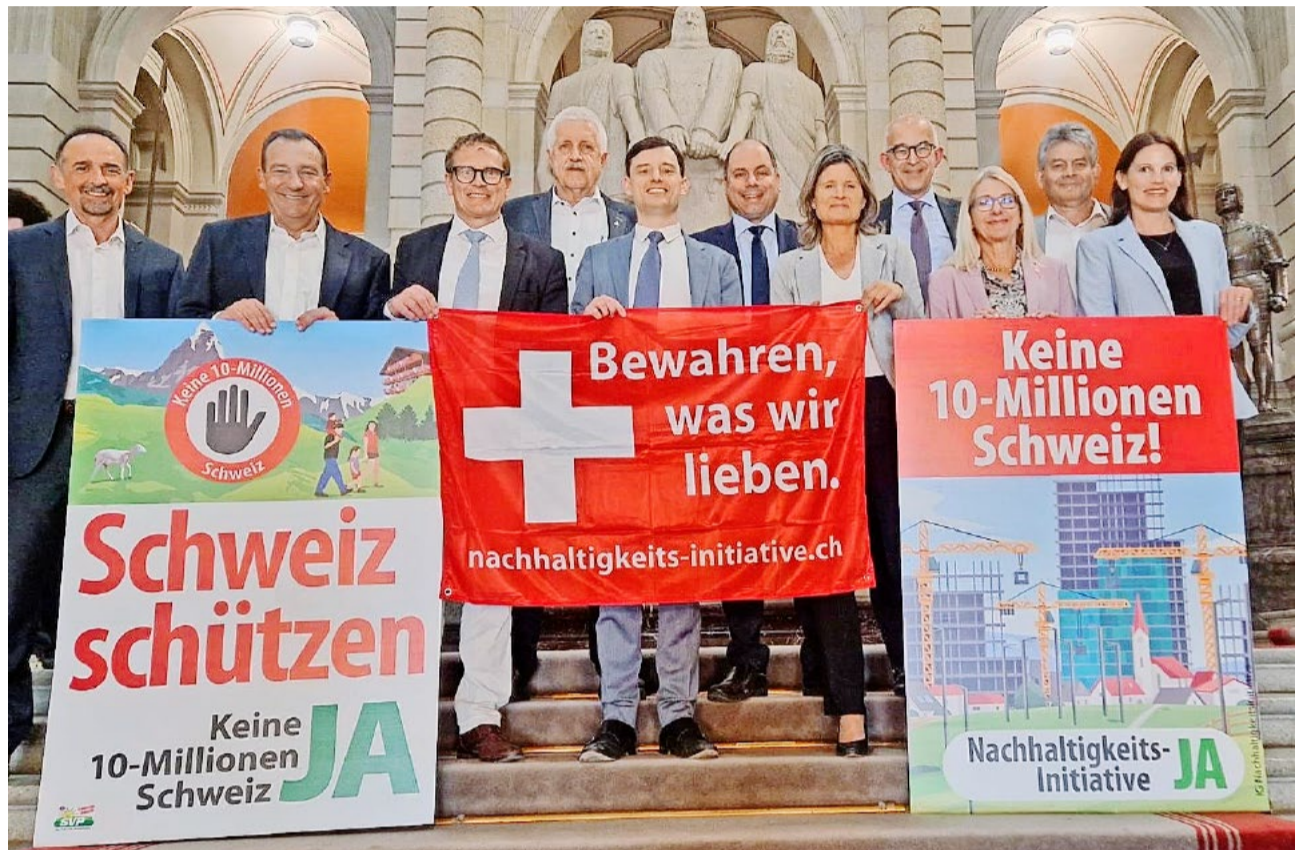
Die Zürcher SVP-Nationalräte rufen Sie dazu auf, am 14. Juni JA zur Nachhaltigkeits-Initiative zu stimmen.

Die Sondersession ist grundsätzlich ruhiger, weil auch weniger Medien und Lobbyisten vor Ort im Bundeshaus präsent sind. Die nächste Session ist im Juni wieder in Bern: Dann steht die dreiwöchige Sommersession an.