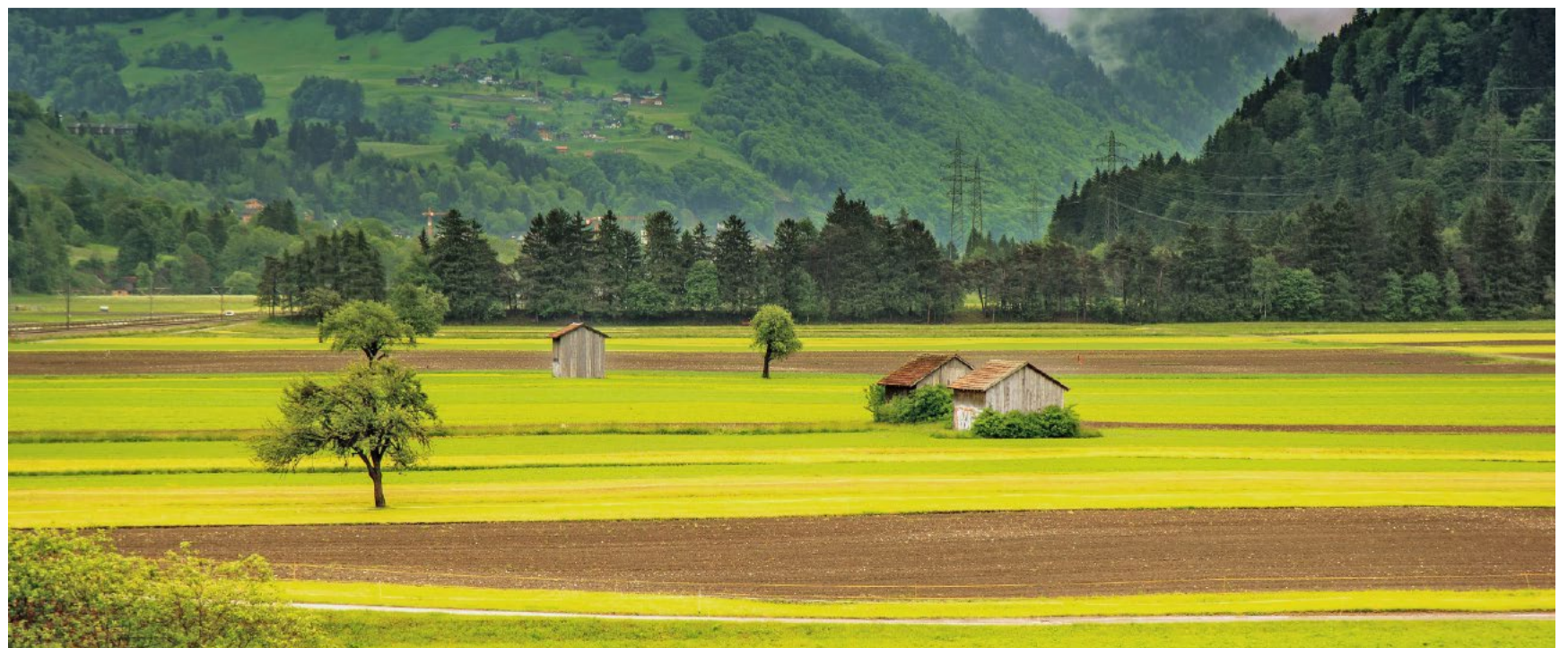
Die Zuwanderung sorgt für immer mehr Druck auf die Fruchtfolgeflächen. Ob sich der Bäuerinnenverband dessen bewusst ist?

liessen? Und ist ihnen bewusst, dass sie vor allem von der SVP unterstützt werden, wenn es um ein würdiges Auskommen für Bauernfamilien geht?