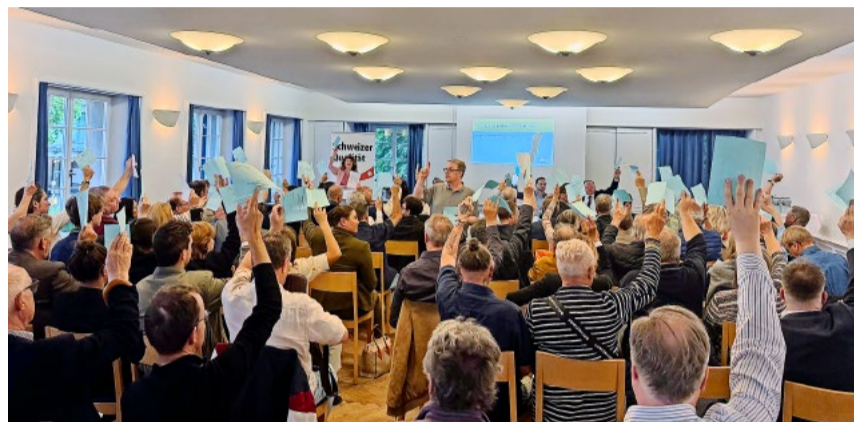
Volles Haus an der SVP-GV in Schwamendingen.