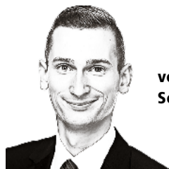
von Sean Burgess