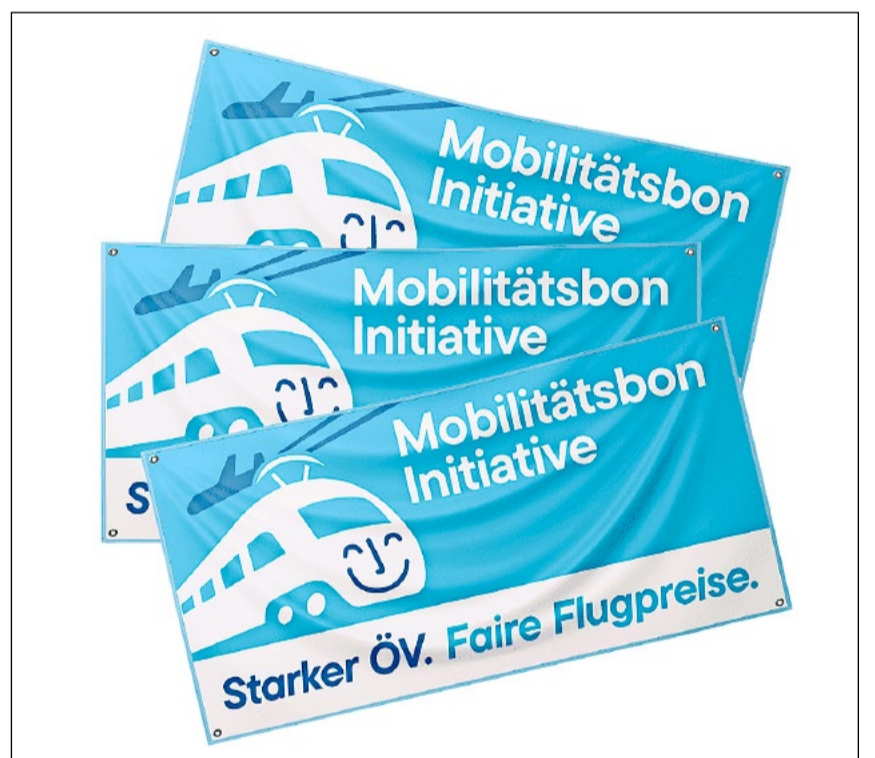
Mit der Mobilitätsbon-Initiative sollen die Bürger noch stärker bevormundet und finanziell belastet werden.