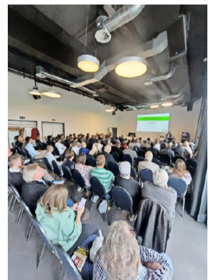
So geht Milizpolitik: Über 100 Teilnehmer fanden sich am Samstagvormittag in Wetzikon ein.

Die Kadertagung 2026 zeigte einmal mehr, wie wichtig der persönliche Austausch, die gemeinsame Analyse und die strategische Ausrichtung für eine erfolgreiche Parteiarbeit sind. Mit dem klaren Fokus auf die kommenden Wahlen und einer verstärkten Kommunikation politischer Inhalte wurden wichtige Grundlagen für die nächsten politischen Herausforderungen gelegt.