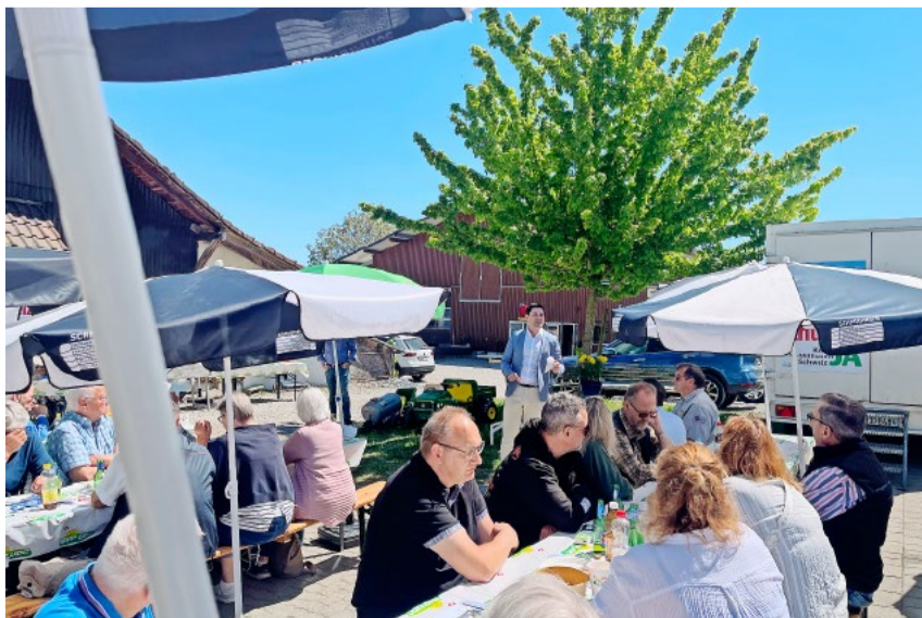
Das 1.-Mai-Fest der Dietiker SVP war einmal mehr gut besucht.

Hier zeigen die Linken ihr wahres Gesicht: günstigen Wohnraum für sich fordern, alle Kinder sollen einen bezahlten Kitaplatz haben, und natürlich auch weitere Vergünstigungen, von denen sie profitieren können. Da gibt es sogar eine Nationalrätin von der SP, die sagt, sie setze sich für den Mittelstand ein! Es ist noch speziell, da sich diese Partei doch nicht mehr für die Arbeiter interessiert. Aber was erwartet man von der SP, wenn sie von den JUSO unterwandert wird, die noch nie im Leben gearbeitet und immer nur vom Staat gelebt haben. Da sage ich nur: Wehret den Anfängen.