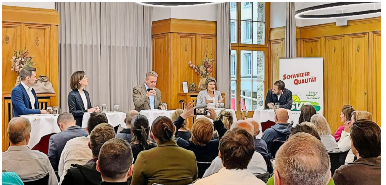
Rund 60 Gäste bildeten sich eine Meinung zur 10-Millionen-Schweiz.