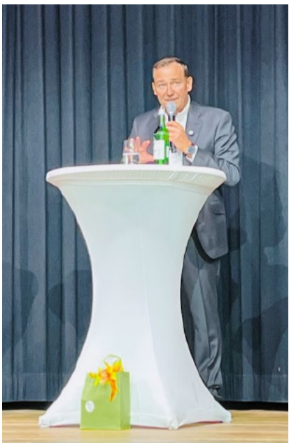
Thomas Matter warb für ein überzeugtes JA zur Nachhaltigkeits-Initiative.