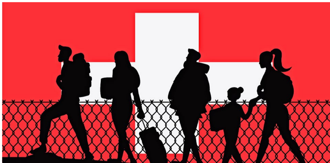
Wer den Sozialstaat schützen will, muss die Zuwanderung restriktiver und selektiver steuern.

Milton Friedman hat es schon vor Jahrzehnten gesagt: Wohlfahrtsstaat und offene Grenzen – beides gleichzeitig gibt es nicht. Die Schweiz versucht es trotzdem. Der Ausgang: der Rückweg ins Armenhaus, aus dem sich unsere Vorfahren mühsam herausgeschuftet haben.