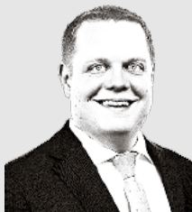
von Patrick Walder

In den nächsten Monaten werden dann auch in den Bezirken die Kantonsratskandidaten nominiert. Diese Kandidatinnen und Kandidaten müssen sich ebenfalls dieser Verantwortung und Erwartung bewusst sein. Dafür dürfen sie sich auf den Wahlkampf freuen, ist der Wahlkampf doch das Highlight der Legislatur. Diese Zeit gibt der Partei und ihren Exponenten die Möglichkeit, die Unterschiede zwischen der SVP und den anderen Parteien aufzuzeigen und mit unseren Lösungen zu überzeugen.