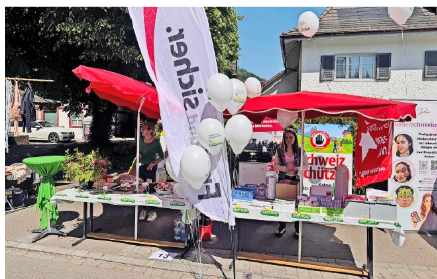
Der SVP-Stand am Stadler Frühlingsmarkt war ein voller Erfolg.

Alles in allem war der Frühlingsmarkt ein voller Erfolg und zeigte einmal mehr, wie wertvoll der direkte Austausch mit der Bevölkerung ist. Die SVP Stadlerberg bedankt sich herzlich bei allen Besucherinnen und Besuchern für das grosse Interesse und die zahlreichen schönen Begegnungen.