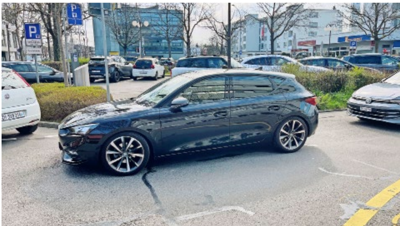
Warten auf einen freien Parkplatz auf dem Adlerplatz.

Wir sind überzeugt, dass wir die Dübendorfer Stimmbevölkerung von unserem Anliegen überzeugen können. Denn es ist auch das Anliegen von den meisten vernünftigen Stimmbürgern in unserer Stadt. So wird es dann Ende September zum Showdown an der Abstimmungsurne kommen. Da die SVP Dübendorf in Verkehrsfragen immer von unserer Bevölkerung unterstützt wird, sind wir überzeugt, diese Abstimmung zu gewinnen.