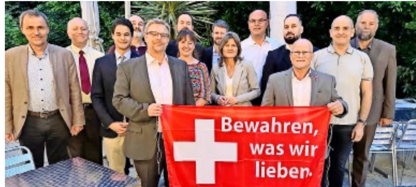
Die Generalversammlung bot Gelegenheit zum Austausch und unterstrich einmal mehr den starken Zusammenhalt innerhalb der Partei.

Jede Stimme zählt – für eine sichere, freie und erfolgreiche Schweiz.