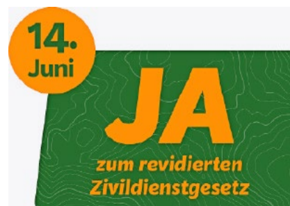
2 x JA: Zum Zivildienstgesetz und zur Nachhaltigkeits-Initiative.

Das Gesetz sieht zwar einen zivilen Ersatzdienst vor. Dieser war ursprünglich aber nur für Ausnahmefälle gedacht. Weil die jungen Schweizer heute aber sozusagen die freie Wahl zwischen Militär- und Zivildienst haben, ist die Zahl jener, die den angenehmeren Zivildienst wählen, auf jährlich rund 7000 (im Jahr 2025 waren es 7211!) hochgeschwollen. So verliert die Armee vergleichsweise jedes Jahr den Bestand einer Kampfbrigade – und von Wehrgerechtigkeit kann keine Rede mehr sein.