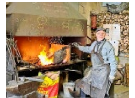
Ein spannender Morgen rund um die Schellenschmiede.