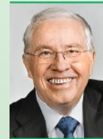
Christoph Blocher Alt Bundesrat SVP Herrliberg

Drei bedeutende Abstimmungen stehen an: Die «Keine 10-Millionen-Schweiz!» (Nachhaltigkeits-Initiative), die Neutralitätsinitiative sowie der EU-Unterwerfungsvertrag. Gemeinsam ist ihnen: der Interessenkonflikt zwischen der Classe politique und dem gesamten Volk.