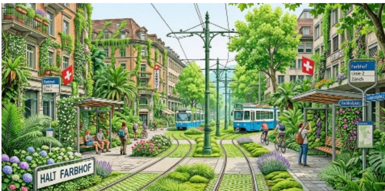
Der Wunschtraum der Grünen ist Albtraum der Steuerzahler.

Ob Zwang für den Detailhandel, «Pocketpark» am Walcheplatz oder Schnellschuss am Farbhof: Die SVP-Fraktion stellt sich gegen ideologische Projekte mit wackliger Rechtsgrundlage, hohen Kosten und Risiken für Sicherheit und Gewerbe, die nur dem Klimawahn geschuldet sind. Wir verlangen einen sorgsam Umgang mit Steuergeldern.