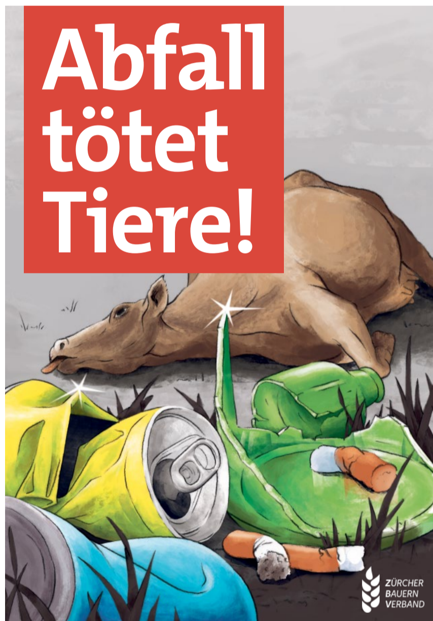
Weggeworfene Dosen oder Plastik gelangen ins Futter. Spitze Metallteile (z. B. Alu) können bei Kühen tödliche Verletzungen auslösen.