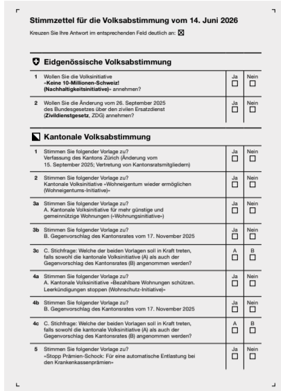
Digitale Auszählungen mit versteckten Fussangeln: Mit der elektronischen Auszählung verschwinden die klassischen Stimmzettel.

Digital betrügen ist weniger schwierig als in der realen Welt. Wahlfälschungen sind oft aufgefliegen, weil das Ergebnis in einer Gemeinde «nicht stimmen kann». Die ganze Schweiz sagt Nein, aber unser Dorf sagt Ja? Der Grüne