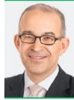
Gregor Rutz Nationalrat SVP und Vizepräsident Staatspolitische Kommission Zürich

Das Vertragspaket Schweiz/EU stellt unsere Verfassung auf den Kopf: Über kantonale Kompetenzen würde neu der Bundesrat entscheiden. Die Volksrechte würden massiv eingeschränkt. Bei der Gesetzgebung wäre das Parlament oft nur noch in einer Zuschauerrolle: Entschieden würde in Brüssel. Daher ist für so ein Vertragspaket das Volk- und Ständemehr zwingend. Genau so sieht es auch die Staatspolitische Kommission des Nationalrats – ein richtungsweisender Vorentscheid.