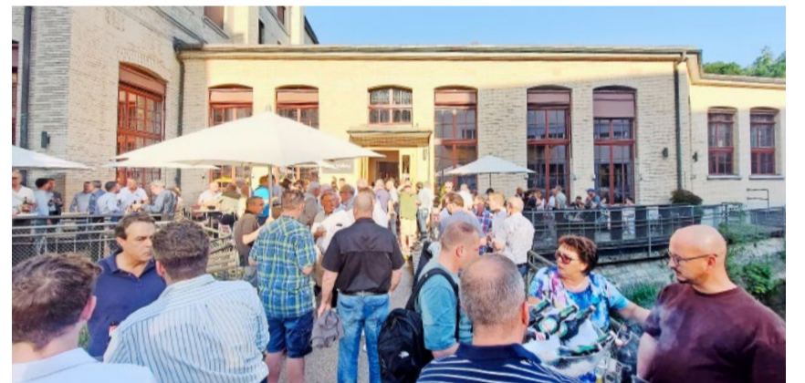
Über 150 engagierte Wahlkämpferinnen und Wahlkämpfer fanden sich bei schönstem Wetter in Kempththal ein.

seine Verbundenheit mit der Partei und deren Engagement zum Ausdruck gebracht hat. Das Dankes-Essen machte deutlich: Die SVP kann auf eine starke Basis und viele engagierte Mitglieder zählen – beste Voraussetzungen für kommende Erfolge.