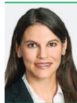
Nina Fehr Düsel Nationalrätin SVP Küsnacht

Ausgerechnet jene Mitte-Links-Kreise, die mit ihrer chaotischen Zuwanderungs- und Asylpolitik für unhaltbare Zustände in unserem Land sorgen, versuchen die Initiative «Keine 10-Millionen-Schweiz!» als «Chaos-Initiative» zu disqualifizieren.