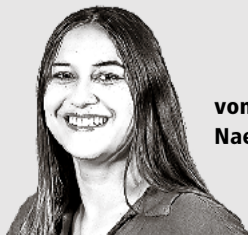
von Naemi Dimmeler

Der 14. Juni wird entscheiden, wie die Schweiz in Zukunft aussieht. Darum sage ich überzeugt: Aus Liebe zur Heimat stimmen wir JA zur Nachhaltigkeits-Initiative «Keine 10-Millionen-Schweiz!». Jede Stimme zählt. Gehen wir an die Urne und schützen wir gemeinsam unsere Schweiz!