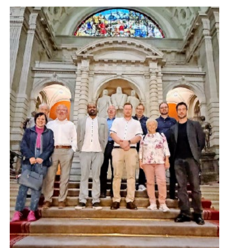
Nationalrat Martin Hübscher begrüsst den 200er-Club im Bundeshaus.