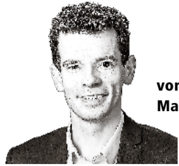
von Manuel Zanoni