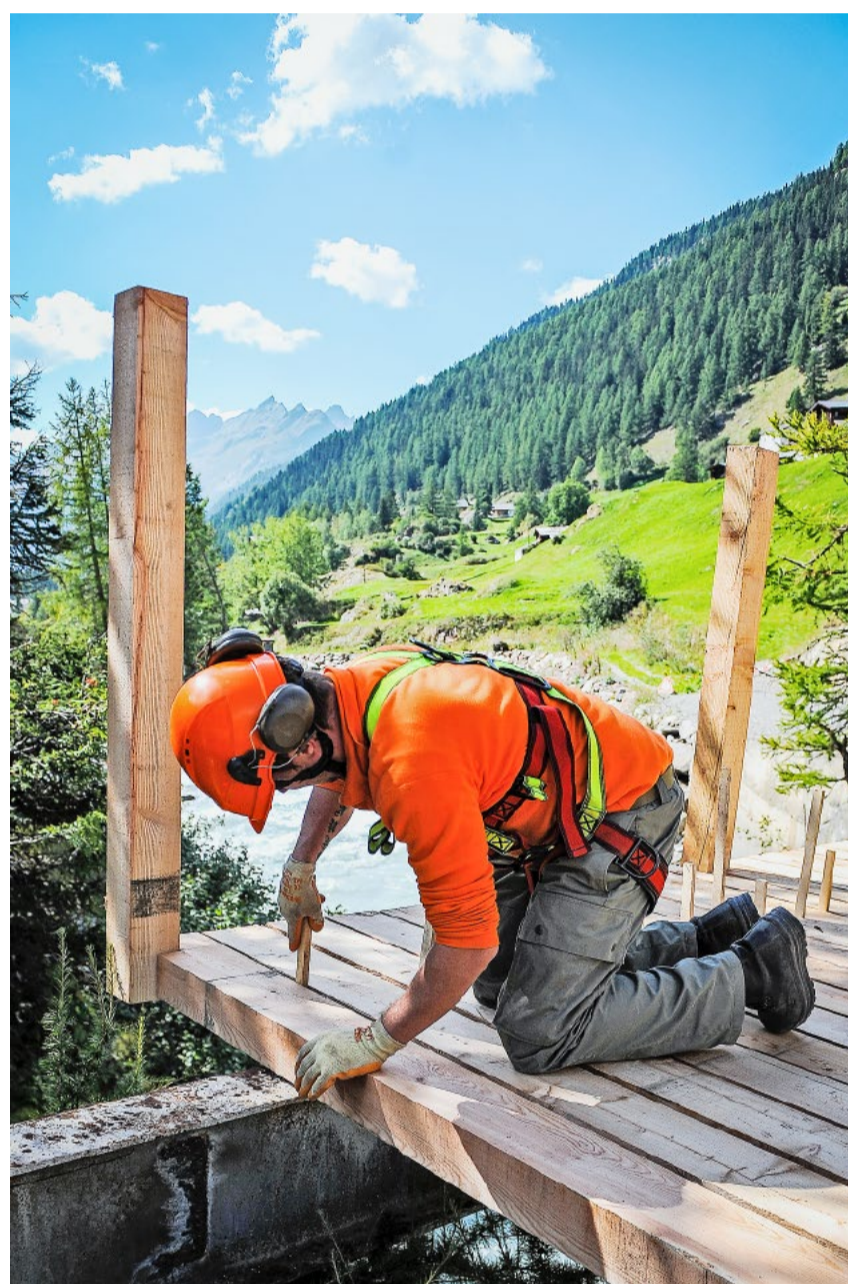
Eine einsatzfähige Armee und ein robuster Zivilschutz sind das Fundament für Schutz und Sicherheit.

dass man im Zivildienst bessergestellt ist. Gemäss Vorgaben muss der Einsatz im Zivildienst etwa dem Einsatz im Militär gleichgestellt sein. Heute ist das definitiv nicht mehr der Fall. Schaut man sich auf dem «Jobportal» des Zivildienstes «ZiviConnect» um, findet man unzählige Stellen, die mit der Grundidee