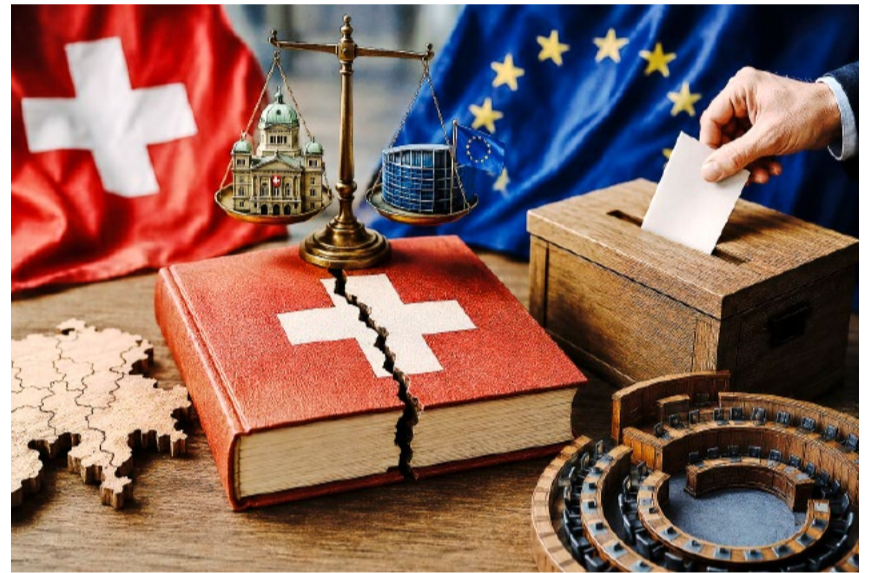
Die SPK-N erachtet ein obligatorisches Referendum aufgrund der verfassungsrechtlichen Tragweite des Vertragspakets als zwingend.

durch die grosse Bedeutung des Vertragspakets, welches verfassungsrechtlichen Charakter hat» (Communiqué vom 22. Mai 2026). Klare Worte der Staatspolitischen Kommission. Auf die nächsten Schritte im Parlament darf man gespannt sein.