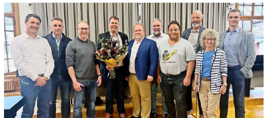
Die SVP-Fraktion des Winterthurer Stadtparlaments.

Insgesamt war die erste Sitzung des Winterthurer Stadtparlaments in der Legislatur 2026–2030 ein institutioneller Auftakt in guter, kollegialer Stimmung.