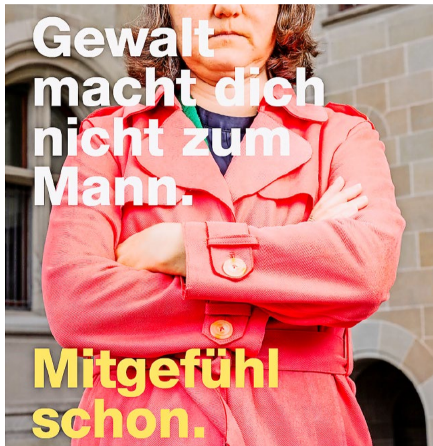
Bereits im März lancierte die Stadt Zürich eine Kampagne gegen Gewalt – auch damals gab es die Plakate nur auf Deutsch.

Wie schön waren doch die Zeiten, als die einzigen Schilder im Freien diejenigen mit den verschiedenen Sorten Glacé waren. Doch etwas hat man dank der vielen Schilder auf dem Spaziergang doch gelernt: Man versteht nun, wie die Reden von Bundesrat Jans entstehen: Die belehrenden Schilder sind nämlich so zahlreich im öffentlichen Raum anzutreffen, dass es schnell einmal passieren kann, dass man dagegen läuft und sich den Kopf stösst. Das könnte den Inhalt der Reden, die Bundesrat Jans beim Laufen entwickelt, endlich einmal schlüssig erklären.